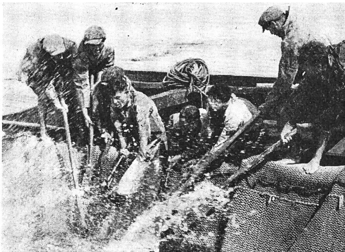
Die zappelnde Beute wird mit Haken an Bord der Fischerkähne geholt.