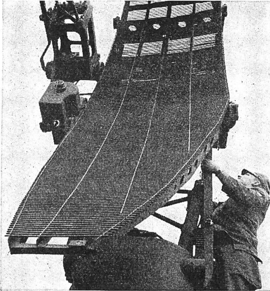
Die Radar - Antenne besitzt einen parabolischen Spiegel aus Metallstäben, der die elektrischen Wellen wie den Strahl eines Scheinwerfers zusammenfasst und aussendet.

dieser Bewegung lässt sich die Entfernung und genaue Lage des Flugzeugs ständig verfolgen, mag es noch so schnell dahinjagen.