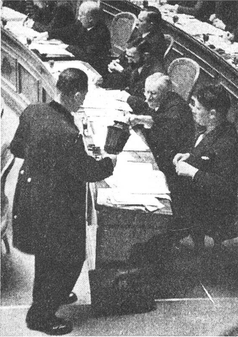
Geheime Wahl. Der Ratsweibel sammelt mit der Urne die Wahlzettel ein.

verlassen deshalb den Saal für zehn bis fünfzehn Minuten. Die Berichte ihres Präsidenten werden rasch genehmigt. Am nächsten Tag will unser Nationalrat bei der Beratung über die Krankenkassen «einstechen», d. h. einen Antrag vorbringen. Er muss sein Votum, das er zu Hause zu Faden geschlagen hat, noch durch Auskünfte ergänzen, die er telephonisch bei Beamten oder unten im Bibliotheksaal einholt. In den Ratssaal zurückgekehrt, arbeitet er an seinem Votum weiter, während er mit einem Ohr der Interpellation über Luftschutz zuhört. Schluss der Sitzung 13 Uhr.