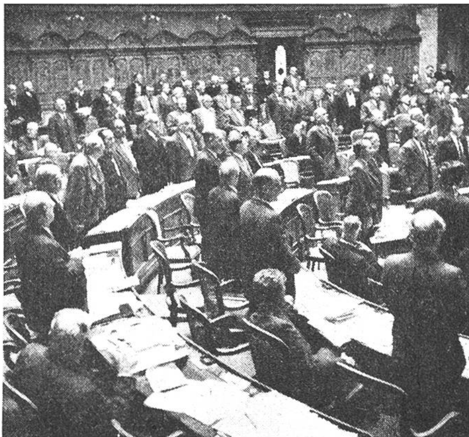
Offene Abstimmung. «Wer dafür ist, bekunde es durch Aufstehen!»

den Bundesrat alle Ratsmitglieder mit Spannung anhören. Abends sind eine Anzahl Nationalräte in einer Gesandtschaft eingeladen, die einen Parlamentarierabend gibt. Es werden Freundschaften geschlossen, die auf den politischen Kampf mildernd einwirken.