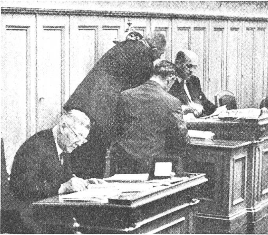
Nationalräte umdrängen das Präsidentenpult, um sich in die Rednerliste einzuschreiben.