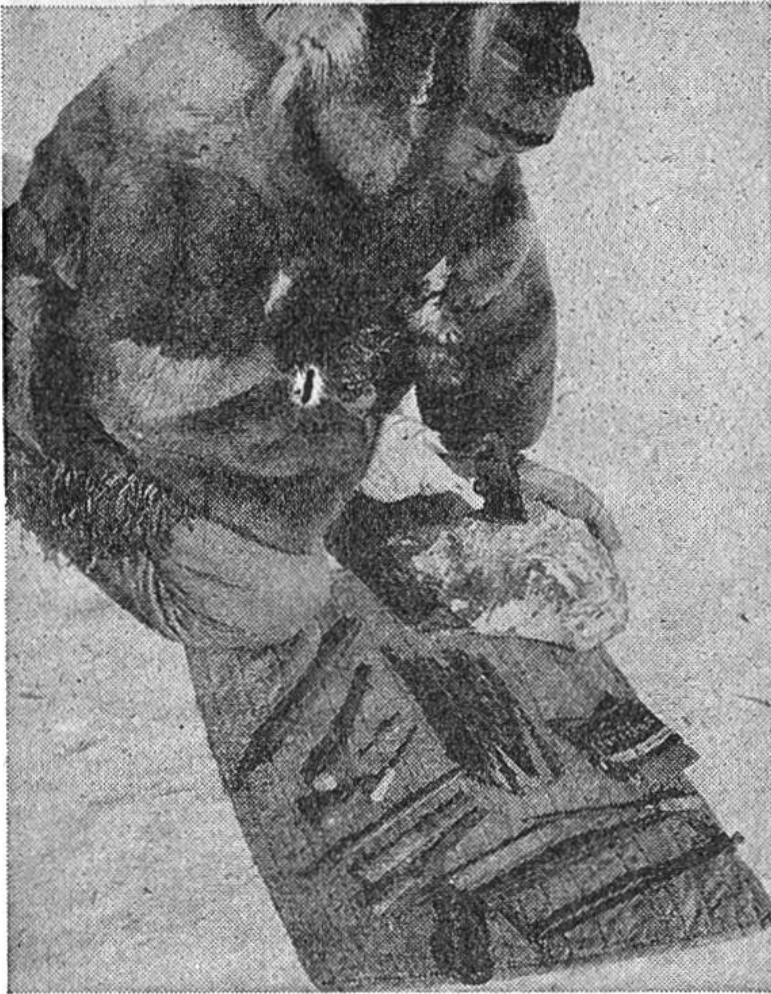
Mit modernen Instrumenten macht sich der Jägerkünstler daran, das Specksteinstück in eine Figur zu verwandeln.

verfolgen. Sie haben eine natürliche Begabung, die es ihnen erlaubt, nach harter Jagd in Mussestunden ihre Waffen und Geräte mit Tier- und Menschenfiguren zu verzieren. Allmählich ging diese Tradition aber weitgehend verloren. Neuerdings haben nun Missionare und Regierungsbeamte die Eingeborenen in Arktisch Kanada veranlasst, sich diese Fähigkeit zunutze zu machen, um zu einem kleinen Nebenverdienst zu gelangen. Es handelt sich um etwas Ähnliches wie bei den Arbeiten unserer Bergbauern, die in den Städten verkauft werden. Nur verraten die Figuren der kanadischen Eskimos, dass diese noch wenig mit der Zivilisation in Berührung gekommen sind. Es geht nicht einfach darum, eine Figur für den Verkauf herzustellen: der Jägerkünstler lebt noch weitgehend in der Gedankenwelt, die er in seinen Plastiken zum Ausdruck bringt. Er stellt die Tiere dar, die er jagt, um leben zu können; ferner Erlebnisse aus seinem Dasein; und nicht selten sind es altüberlieferte Geschichten oder Legenden, die den Stoff liefern.