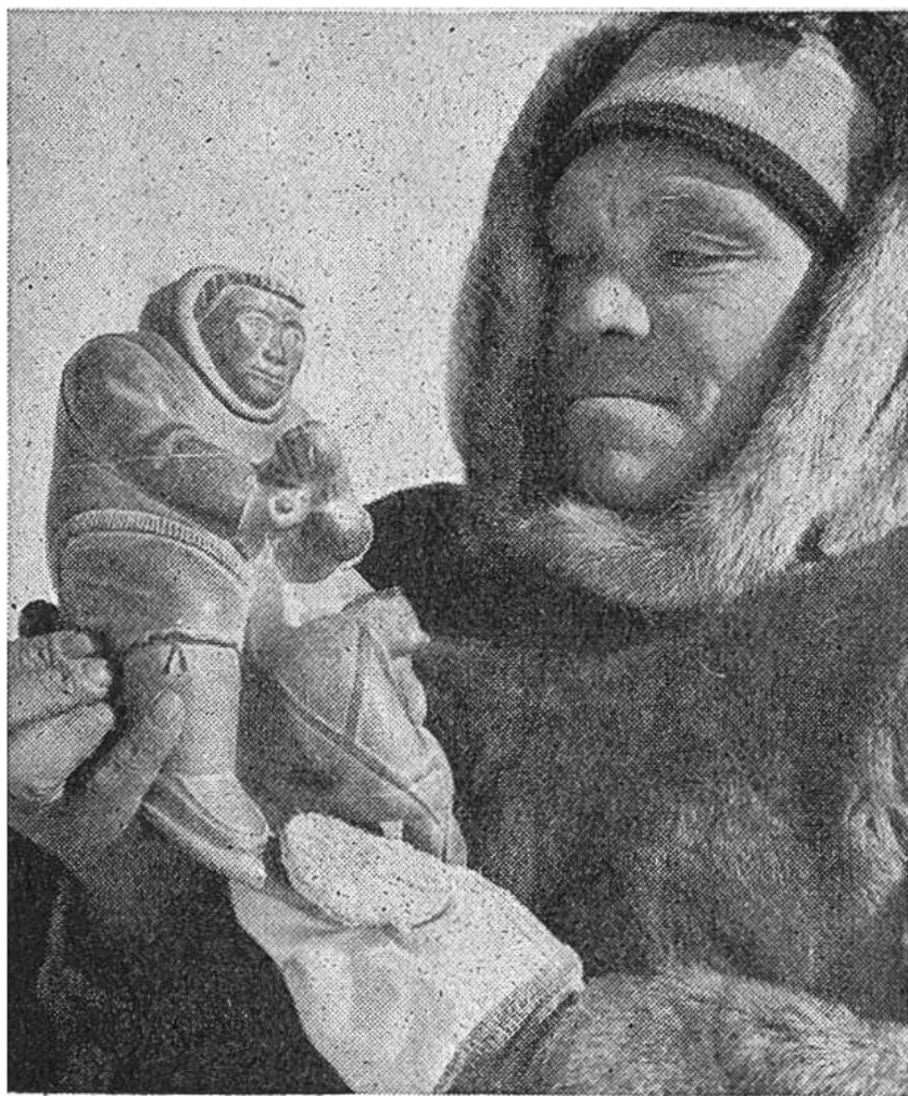
Nicht ohne Stolz wird das fertige Stück – ein Eskimo mit Hund – von seinem Schöpfer betrachtet.

erst gilt es, eine Stelle ausfindig zu machen, wo der verhältnismässig leicht zu bearbeitende, ziemlich weiche Speckstein – früher benützte man dieses Material zur Herstellung von Tranlampen und Kochtöpfen – vorkommt. Hat man am betreffenden Platz Eis und Schnee entfernt, wird mit dem Brecheisen ein genügend grosses Stück losgelöst und dann mit dem Hundeschlitten nach Hause transportiert (das «zu Hause» kann noch heute im Winter eine Schneehütte, ein «Iglu» sein). Dort geht der Eskimo bei Gelegenheit daran, aus dem Block eine Figur herauszuarbeiten. Natürlich benützt er dazu nun Werkzeuge aus Eisen und Stahl, die er gekauft hat; früher waren es Steininstrumente. Aber die Phantasie, mit welcher die Arbeiten ausgeführt werden, ist bei den heutigen Eskimos gleichgeblieben wie bei ihren Vorfahren. Nie entspricht ein Stück dem andern. Oft wird der Jägerkünstler schon durch die Form des rohen Steinblockes inspiriert; vor seinem geistigen Auge sieht er darin bereits die Figur, die er herausmeisseln will: einen Seehund, ein Walross, einen Fuchs,