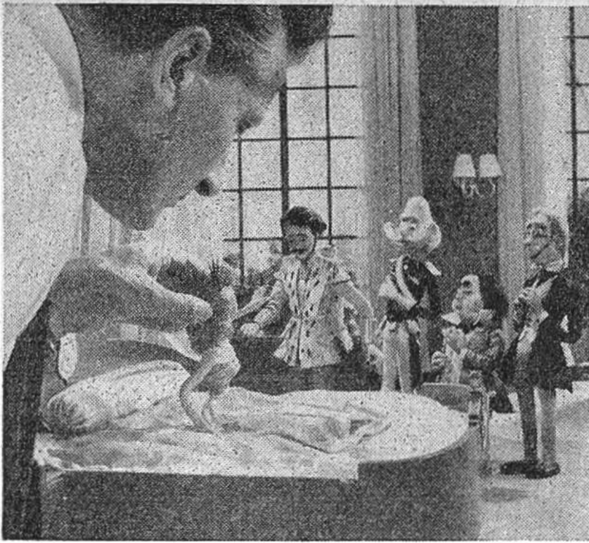
Die Prinzessin in ihrem Prunkbett wird für die nächste Szene bereitgemacht.