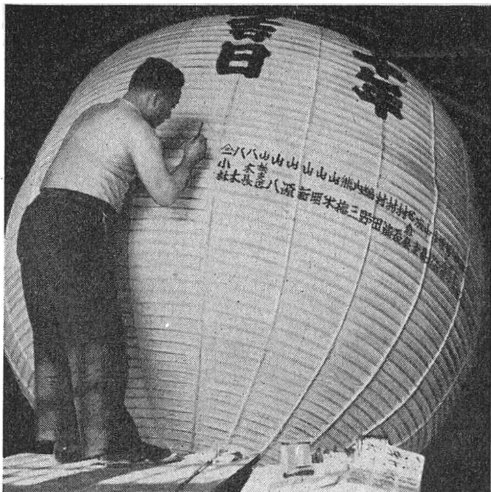
Auf einer Riesenlaterne für einen Tempel werden die Namen der Stifter mit Pinsel aufgetragen.

men und Farben bringen kann, haben diese sich eine grosse Beliebtheit erworben. Heute noch sieht man in Japan diese Lampen überall als Schmuck der Strassen und Häuser, insbesondere der Restaurants. Auch Tempel üben mit solchen Lampen eine grosse Anziehungskraft auf die vorbeieilenden Fussgänger aus. So hängt zum Beispiel die grösste Papierlaterne Japans im Asakusa-Tempel in Tokio.