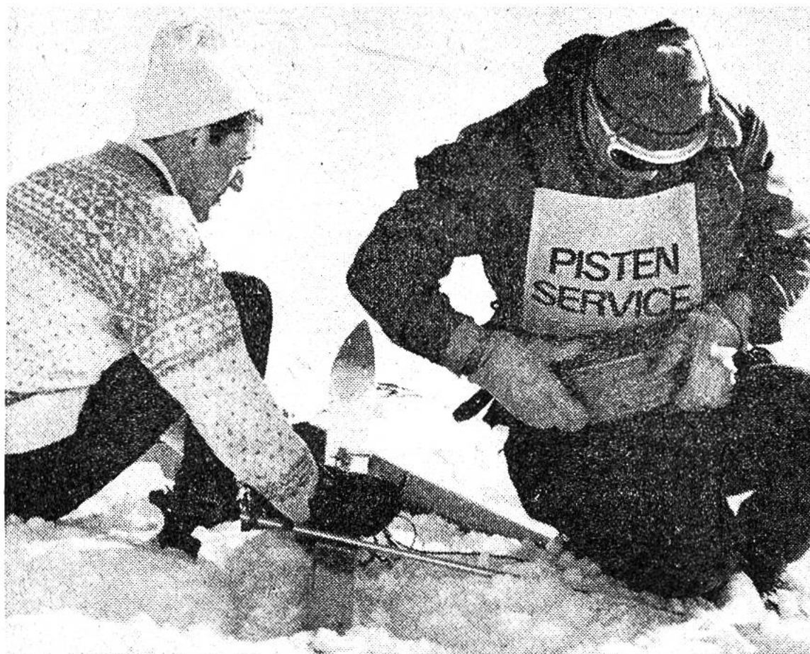
Ein hilfsbereiter Pistenpatrouilleur im Einsatz.

jedermann. Es kann nicht dem Urteil des einzelnen überlassen sein, ob er eine gesperrte Piste für sicher genug hält oder nicht. Selbst wenn ihm auf der gegen die Vernunft erzwungene Abfahrt nichts zustossen sollte, könnten andere gutgläubig seinen Spuren folgen und ins Verderben fahren. Beispiele dafür gäbe es recht viele. Anweisungen der Mannen vom Rettungsdienst oder Pistenservice sollen im Interesse der Sicherheit aller unbedingt beachtet werden.