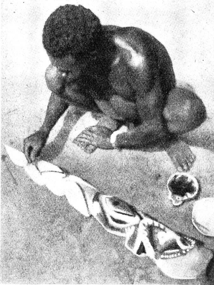
Bemalen einer geschnitzten Holzfigur. Maprik.

abnötigt. Nicht von ungefähr sind Werke dieser Art in den letzten Jahrzehnten auch in ihrem künstlerischen Wert erkannt worden. In vielen Museen gehören sie schon heute zu den grössten Kostbarkeiten. Dabei erwecken aber solche ausgestellten Stücke häufig eine falsche Vorstellung, weil sie unbemalt sind. In dieser Form verwenden die Eingeborenen von Nord-Neuguinea ihre Schnitzereien nie. Sie werden durchwegs vor dem Gebrauch bemalt und bei Zeremonien benützt, wo sie als Vergegenwärtigungen übernatürlicher Mächte gelten. Für jede Feier bemalt man die Figuren neu. Da es sich aber um leicht abfallende Erdfarben handelt, kommen sie nur sehr selten farbig in unsere Sammlungen.