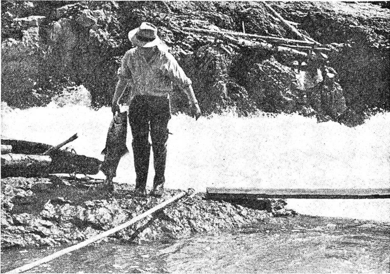
Soeben hat ein Indianer in British Columbia einen zwanzig Kilogramm schweren Salm gefischt.