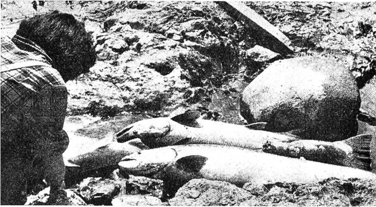
Schöne grosse Frühlings-Salme, der Tagesfang eines Indianers.

sie bald nach Beendigung des Laichens, ohne jemals wieder ins Meer zurückzukehren.