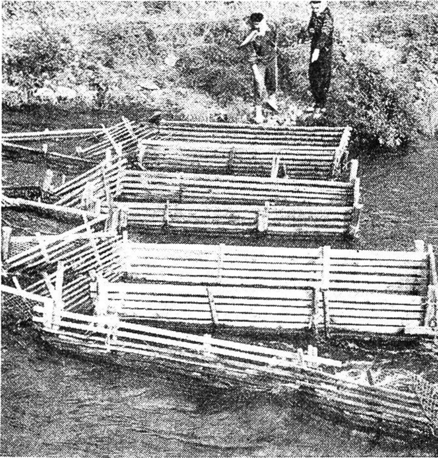
Oft verwenden die Indianer Fischreusen zum Fang der Salme. Zwischen den einzelnen Reusen müssen Durchgänge offen bleiben, damit einzelne Fische die Laichplätze erreichen können.

wo grössere Fische ihnen nachstellen und viele von ihnen verzehren. Ihrem Instinkt folgend, beginnen die grösser werdenden Salme flussabwärts, merkwürdigerweise meist mit dem Schwanz voran, sich treiben zu lassen. Erst wenn sie das salzige Wasser erreichen, wenden sie und schwimmen in das offene Meer hinaus. Man weiss bis heute nicht, wo sie sich in den folgenden Jahren aufhalten. Vielleicht finden sie unter dem Packeis des nördlichen Eismeeres Schutz und Futterplätze. Noch viel merkwürdiger ist, dass sie nach vier bis fünf Jahren als ausgewachsene und fortpflanzungsfähige Fische wieder in den gleichen Küstenabschnitten erscheinen, denselben Fluss, den sie einmal heruntergetrieben sind, aufsuchen und schliesslich ihre heimatlichen Laichplätze wieder erreichen, wo das Weibchen bis zu 20000 Eier in Kieslöcher legt, die es mit dem Schwanz selber gräbt. Kaum haben die Salme die Wanderung flussaufwärts begonnen, hören sie mit der Nahrungsaufnahme auf. Die Überwindung der Strömung und der Wasserfälle sowie das Laichgeschäft lassen die Fische erschöpfen, und – im Gegensatz zum atlantischen Salm – sterben