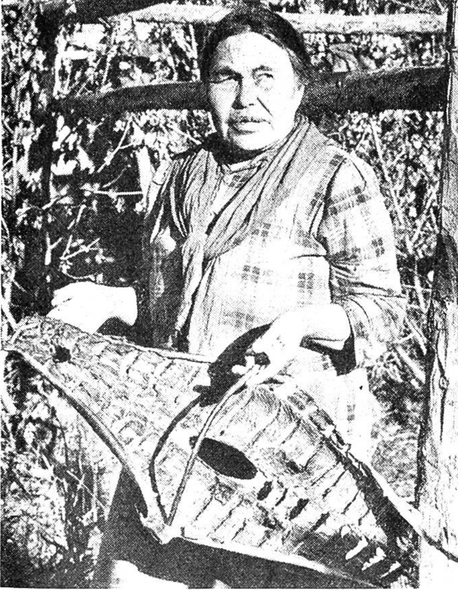
Indianerin im Yukongebiet (Alaska) mit Salm, der zum Räuchern vorbereitet ist. Der Fisch ist aufgeschlitzt, gespannt und sein Fleisch mit tiefen Schnitten versehen worden.

dirbt rasch, und darum muss der Fisch sofort verarbeitet werden. Geräucherter Lachs und Konserven-Salm sind die bekanntesten Formen, in denen er auf dem Markte erscheint.