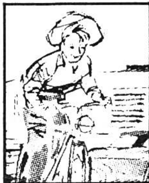
Im Kalender Seite .....