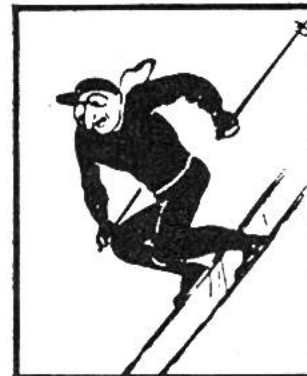
Im Schatzkästlein Seite .....