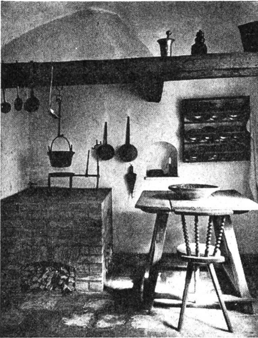
Innenansicht einer Küche im «Fuggerei-Museum».

Jahr vermietet. Hier leben arme Augsburgerbürger. Sie müssen nach den Fuggerei-Vorschriften verheiratet, katholisch und gut beleumdet sein. Wie vor 400 Jahren gelten die alten «Stadt-Regeln». So werden am Abend die Tore geschlossen. Will ein Bewohner verspätet in seine Stadt eintreten, so muss er eine kleine Entschädigung bezahlen.