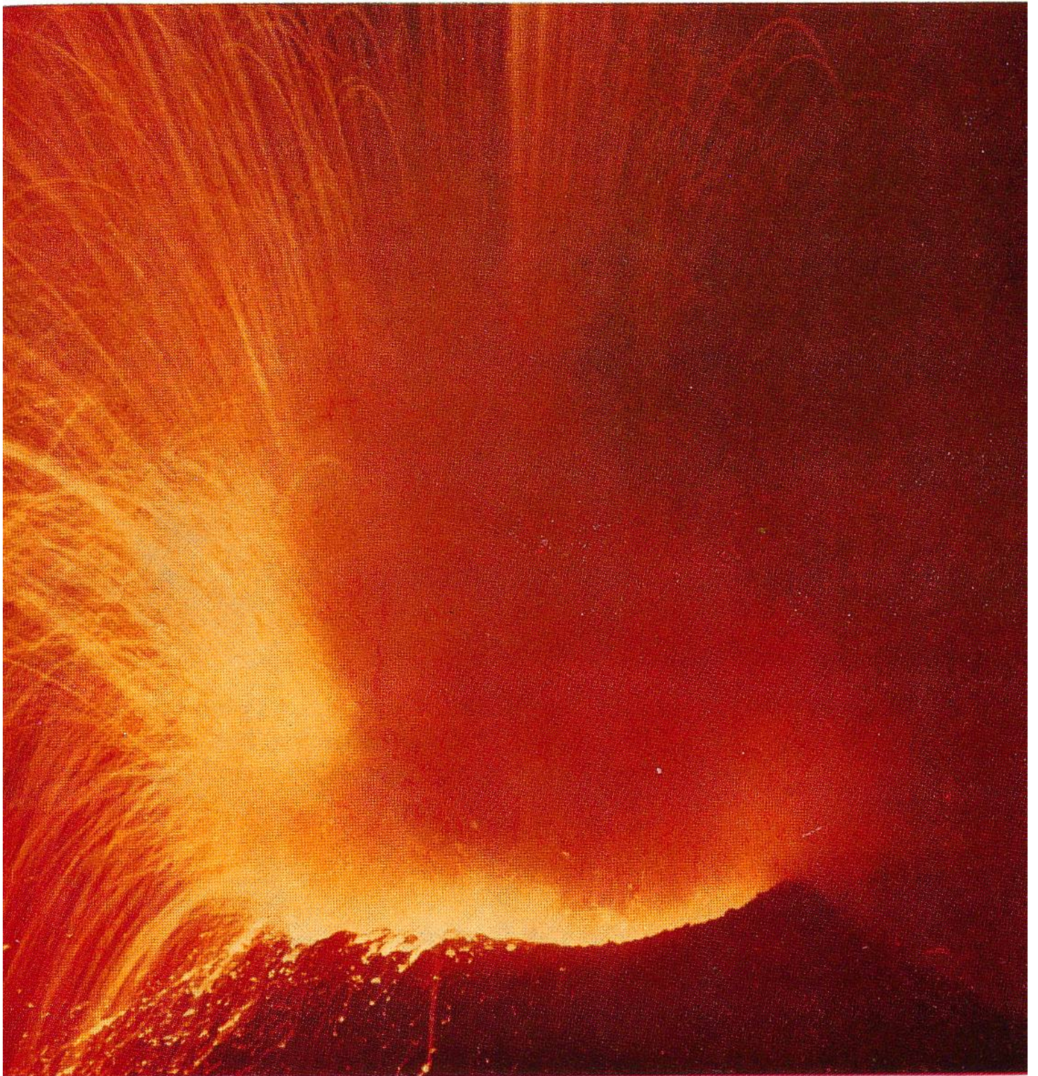
Vulkanische Explosion im Krater des Stromboli. Aufnahme bei Morgendämmerung.