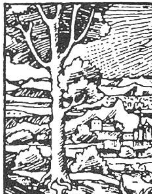
Im Schatzkästlein Seite .....