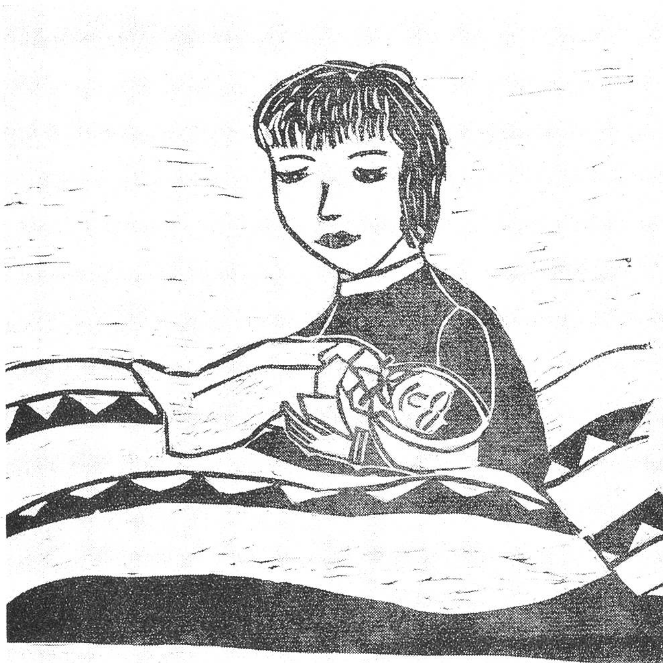
«Mein Schwesterchen mit Bäbi», Linolschnitt von Lucie Wiesner (11 Jahre), Pontresina.

Allgemeine Hinweise: Wählt ein geeignetes Papier. Die Wahl der Technik ist freigestellt. Wenn etwas farbig interessant ist, wählt Farbstifte, Kreide oder Wasserfarbe. Nicht erwünscht sind technische Spielereien wie Rissarbeiten. Die Zeichnungen sollen das Format von 30 \times 42 cm nicht übersteigen. Der Talon auf Seite 131 ist – richtig ausgefüllt – auf die Rückseite der Zeichnung zu kleben.