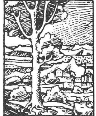
Im Schatzkästlein Seite .....