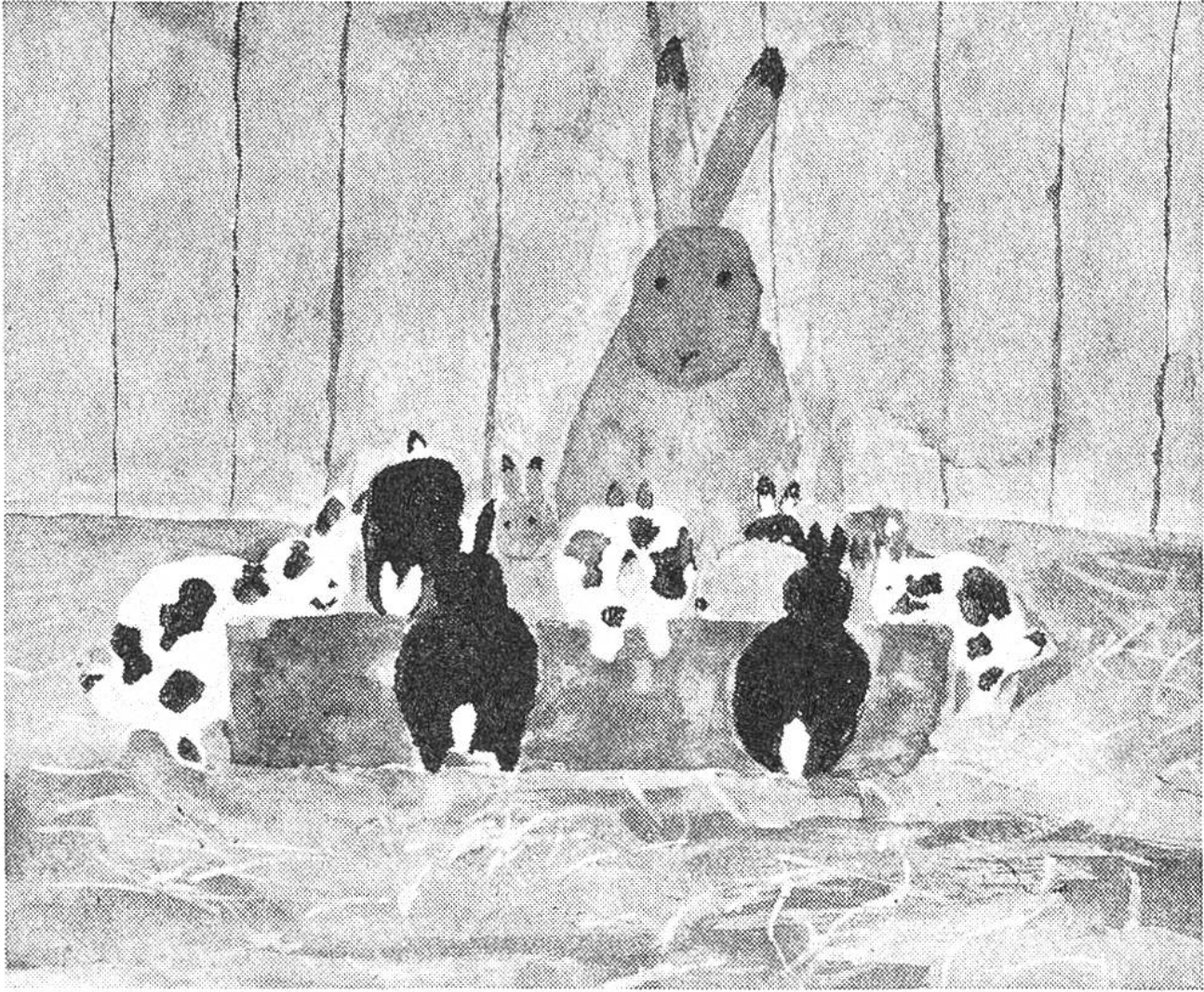
«Meine Kaninchen erhalten Haferflocken», Aquarell von Ursula Käser (8 Jahre), Ersigen.

Zustellung der Preise. Die Preise gelangen nach Erscheinen des neuen Jahrganges zum Versand.