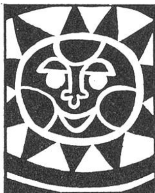
Im Kalender Seite .....