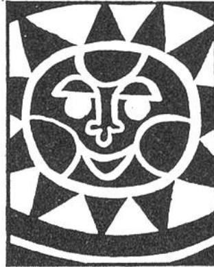
Im Kalender Seite .....