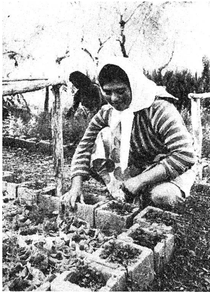
In Töpfen werden die jungen Zedern aufgezogen und später in die freie Natur gepflanzt.