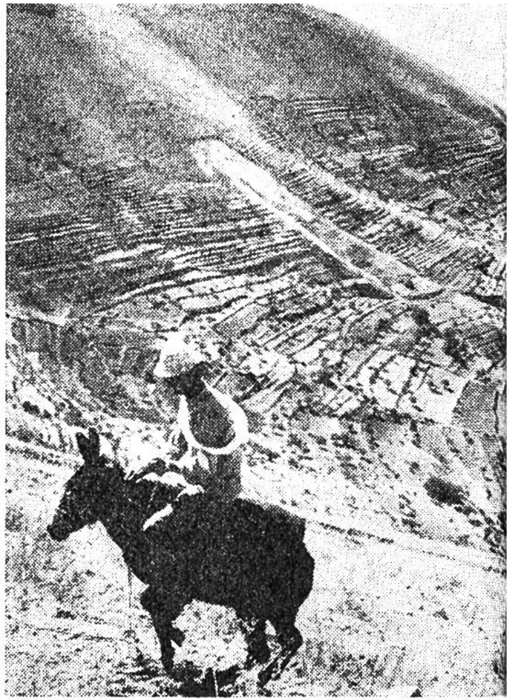
Auf diesen Hängen des Libanon werden bald Tausende von jungen Zedern stehen und dem Land das alte Gepräge verleihen.

antreiben, welche die Holzblöcke für Ägypten tragen sollen. Gib mir die Seile, die du gebracht hast, um die Zedernholzblöcke anzubinden, die ich schlagen lassen soll ...»