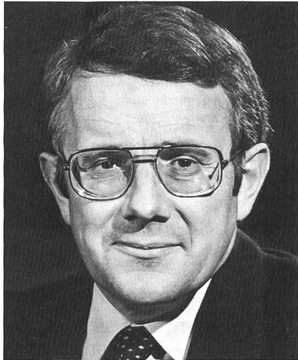
Arnold Koller

Arnold Koller: Geboren 29. August 1933, von Gossau und Oberbüren (SG) — Prof. Dr. iur. et lic. oec. — Professor und Direktor am Institut für europäisches und internationales Wirtschafts- und Sozialrecht an der Hochschule St. Gallen — Nationalrat — 1986 Bundesrat.