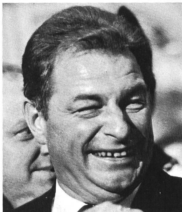
Jean-Pascal Delamuraz (EVD)

Schutz und Förderung von Industrie, Handel, Gewerbe, Landwirtschaft, Aussenhandel — Aufsicht über Veterinärwesen, wirtschaftliche Kriegsvorsorge, Konjunkturfragen, Wohnungswesen.