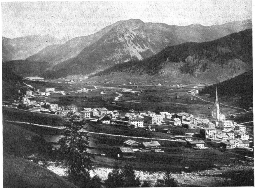
Abb. 1. Davos im Jahre 1874.

Betrachten wir das Bild einer Ortschaft wie Davos, betrachten wir vor allem die Entwicklung dieser Ortschaft, die sie in den letzten 70 Jahren durchgemacht hat (Abb. 1 u. 2), so wird es recht anschaulich klar, warum Tourismus, Hotellerie und Kurortbetrieb mit dem Sammelbegriff Fremdenindustrie bezeichnet werden. Ist nicht der Anblick einer solchen Ortschaft derjenige eines richtigen Fremden-Industrie-Quartiers. Hier steht die Planung vor schwierigen Aufgaben. Die Gemeindebehörde von Davos hat sich heute voller Mut an die Arbeit gemacht; doch es wird nicht leicht sein, einen solchen Steinhaufen in eine geordnete menschliche Landschaft umzuwandeln.