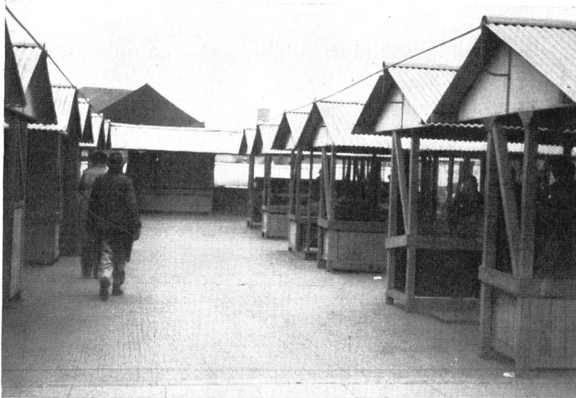
Abb. 3. Provisorische Marktstände im Zentrum von Coventry.