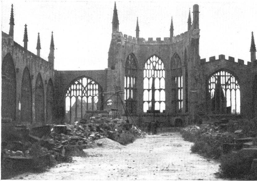
Abb. 1. Coventry. Die Ruine der Kathedrale.