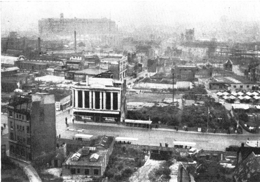
Abb. 1. Blick vom «spire» in den westlichen Teil des ausgebombten Stadtinnern mit provisorischen Bauten. Hier wird das künftige Ladenzentrum liegen.