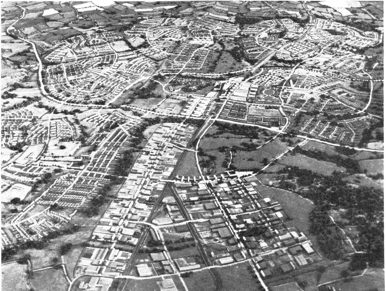
Abb. 2. Modellaufnahme der projektierten Stadt Ongar von Osten aus gesehen.