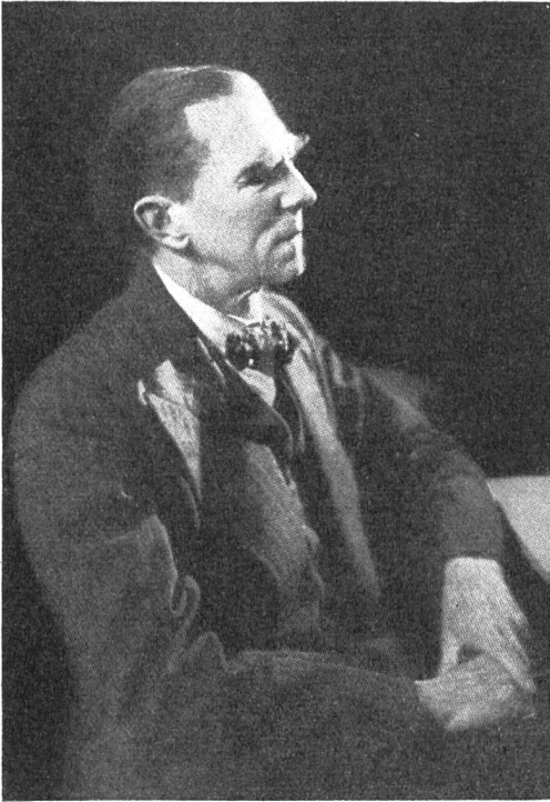
Abb. 1. Der bekannteste englische Planungsfachmann ist heute Prof. Sir Leslie Patrick Abercrombie M. A., F.R.I.B.A. Geboren 1879 in England, erwarb er später einen Teil seiner Mittelschulbildung in der Schweiz (Luzern) und seine architektonische Ausbildung in Manchester und Liverpool. Kurz nach seiner Ausbildung begann schon seine Lehrtätigkeit und mit 36 Jahren wurde er Professor für Architektur an der Universität Liverpool. Seit 1935 ist er Professor für Städtebau an der Universität London (University College). Seine bekanntesten Planungswerke, die meistens durch ausführliche Publikationen dokumentiert wurden, sind folgende: Dublin 1923, Region East-Kent 1928, Region Bristol-Bath 1930, The Cambrian 1932, Hull 1938, Plymouth 1942, Grafschaft London 1943, (County of London Plan), Regionalplanung London und Umgebung 1944 (Greater London Plan). 1945 wurde er für seine Verdienste um das Wohl seines Landes geadelt.