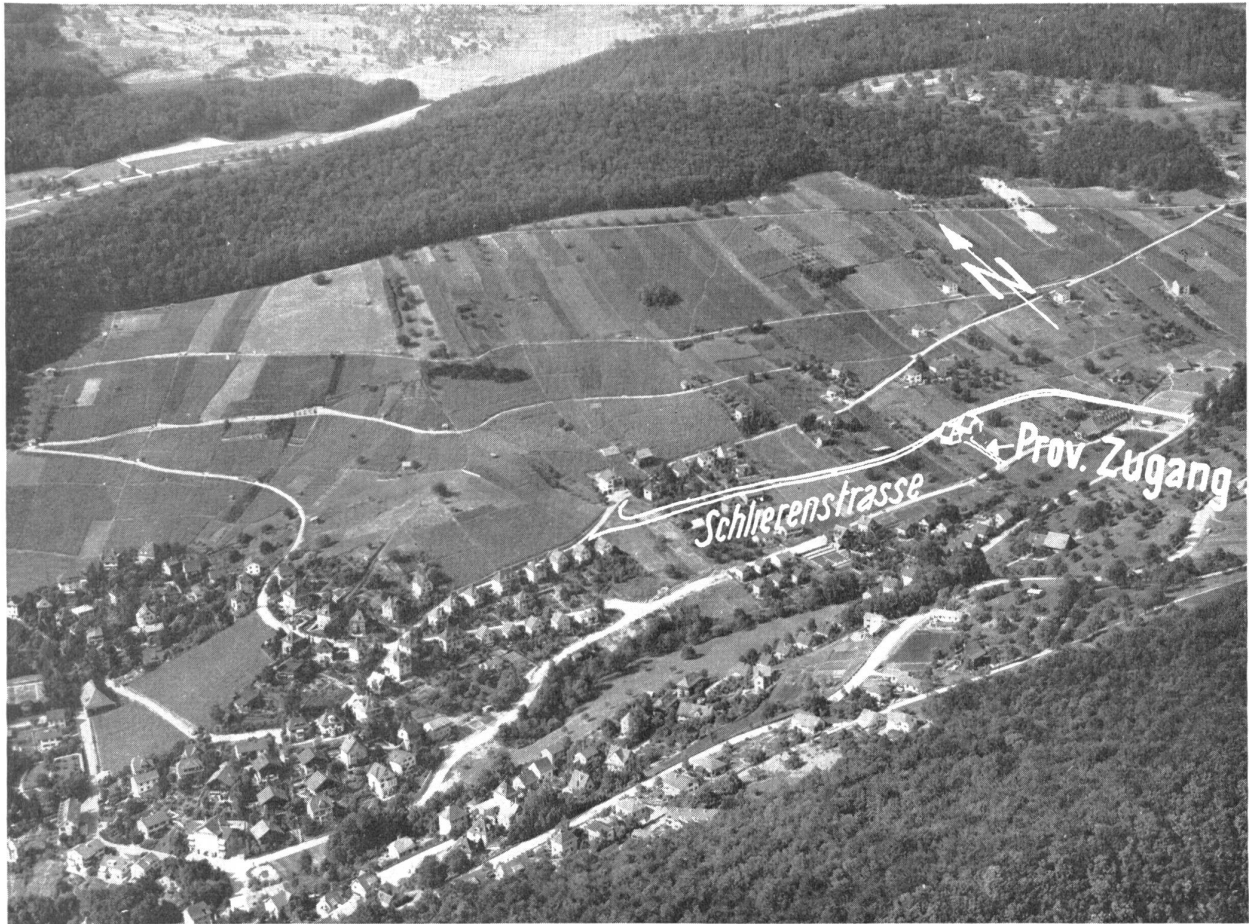
Abb. 1. Fliegeraufnahme der Vorortsgemeinde mit eingezeichneter projektierte Schlierenstrasse und vom Gemeinderat abgelehnter provisorischer Zufahrt von der südlichen Quartierstrasse her.

baut werden. Wenn der Gemeinderat für die Realisierung dieser Strasse besorgt ist, so tut er es im Interesse einer richtigen Baulanderschliessung. Erwünscht wäre, wenn ein Grossteil der Anstösser den Strassenbau verlangen und — unter der Aufsicht des Gemeinderates — durchführen wollte.