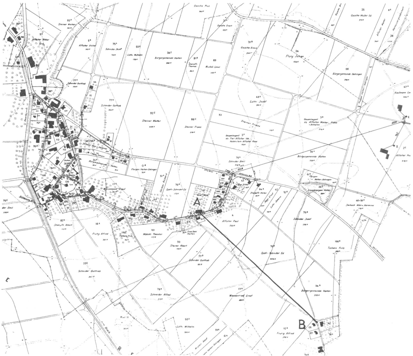
Abb. 1. Mit Subventionen in der Gemeinde H. erstellte Bauten B auf den Grundstücken 126 und 127 an der Peripherie der Gemeinde unter der Bedingung, dass Eigenwasserversorgung durch Senkbrunnen erstellt wird und das Schmutzwasser in abflusslose Jauchegruben geleitet wird. Nach wenigen Jahren muss die Gemeinde mit Unterstützung der Brandversicherung diese Bauten doch mit Druckwasser versorgen, da die Eigenversorgung nicht befriedigt.

nanzausgleichsfonds Unterstützung erhalten. Sei es durch einmalige à fonds perdu-Beiträge an solche Anlagen oder sei es durch jährlich wiederkehrende Beiträge, solange die Gemeinde beitragsberechtigt ist.