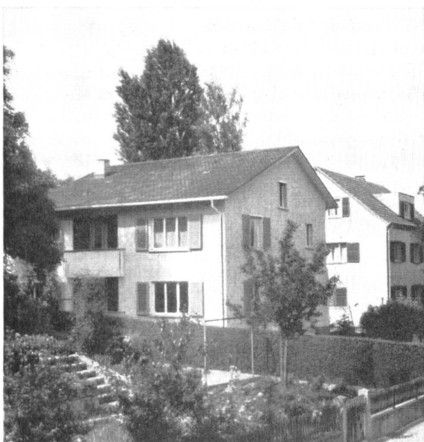
Abb. 5. Der Umbau ist vollendet. Nur der Eingeweihte weiss, dass das Gebäude eine Transformatorstation birgt.

Bei Landankäufen achtet das Elektrizitätswerk ganz besonders darauf, dass es nicht nur den kleinen Raum für die Transformatorstation, sondern auch etwas Umschwung erwirbt. Es lassen sich dadurch später eventuelle Erweiterungen ohne Schwierigkeiten lösen.