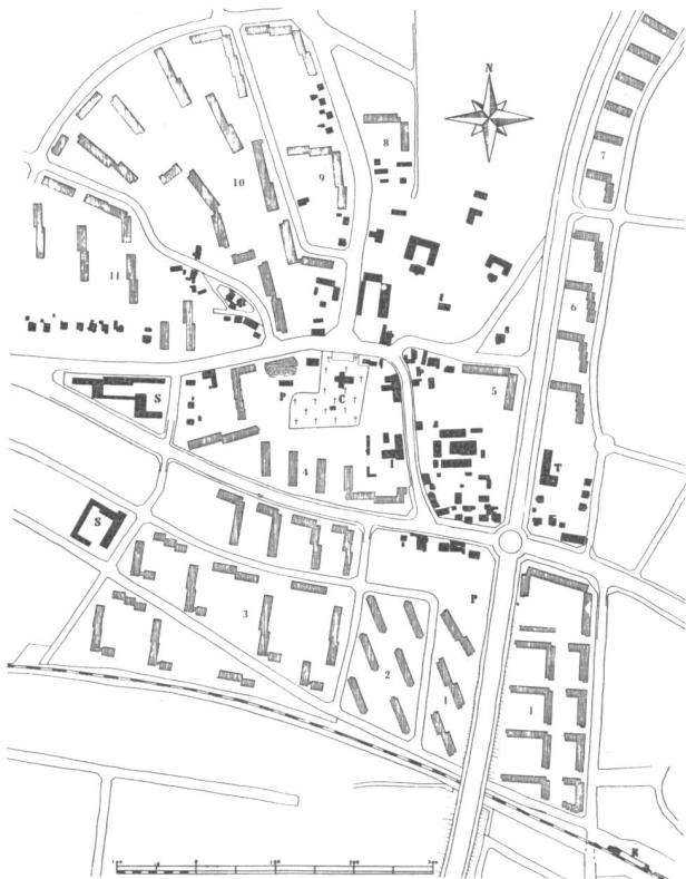
Abb. 2. Stadtplan von Herlev. Wohnquartiere I bis II (schraffiert) wurden alle nach 1945 gebaut. C = Kirche; I = Gemeindegasthof; P = öffentlicher Park; S = Schulen; T = Stadthaus; R = Bahnstation.

Das Tätigkeitsfeld, welches für die dänischen Landschaftsarchitekten heute im Vordergrund steht, ist die Ausgestaltung von Wohnquartieren, woraus schätzungsweise 60 bis 80 % des Geschäftsumsatzes resultieren. Daneben beschäftigen sie sich auch mit der Erstellung von öffentlichen Parks, Schulen, Spitälern, Friedhöfen, Fabriken, Sportplätzen, mit militärischen Objekten und Strassenbepflanzung. Der Privatgarten tritt mehr und mehr in den Hintergrund, ohne jedoch vernachlässigt zu werden. An der eigentlichen Stadt- und Regionalplanung hingegen waren die dänischen Landschaftsarchitekten bis heute nur sporadisch beteiligt, was wohl darauf zurückzuführen ist, dass ihre Arbeitskraft gegenwärtig und noch für eine Reihe von Jahren in den schon der Bautätigkeit erschlossenen Gebieten voll absorbiert ist.