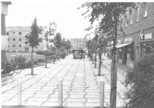
Abb. 3. Hauptgeschäftsstrasse in Herlev.

Sie hatten sich nicht nur um die Gartenarbeiten, mit den verschiedenen Bepflanzungen, Rasenanlagen, Spielplätzen usw., sondern ganz allgemein um die gesamten Planierungsarbeiten und zum Teil auch um die Erstellung der Strassen zu kümmern. Im übrigen wurde alles in enger Zusammenarbeit mit den Bauarchitekten und Tiefbauingenieuren geplant.