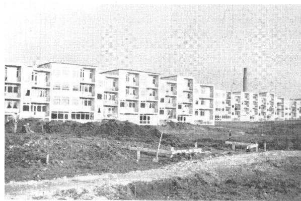
Abb. 5. Wohnquartier Nr. 10. Die Projektierungs- und Planierungsarbeiten wurden ganz von Landschaftsarchitekten ausgeführt.

Die Organisierung der Wohnbautätigkeit, wie sie hier am Beispiel von Herlev geschildert wurde, dürfte für ganz Dänemark charakteristisch sein. Sie gestattet sicherlich auch dem ausländischen Leser, sich über die Tätigkeit des dänischen Landschaftsarchitekten ein Bild zu machen.