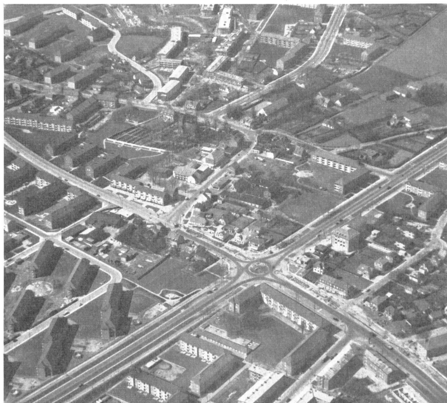
Abb. 1. Herlev: Flugaufnahme des Stadtzentrums.

Präsident der Dänischen Vereinigung der Landschaftsarchitekten, Kopenhagen