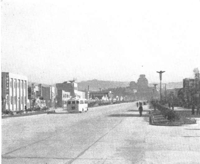
Abb. 1. Himeji-Burg. Ansicht vom Bahnhof her.

Wohl bestehen sie heute meist nicht mehr, doch ihre Gärten, ihre rechteckigen, kleinen Aussenbastionen und mächtigen Steinwälle bieten genügend Platz für öffentliche Parks und historische Denkmäler.