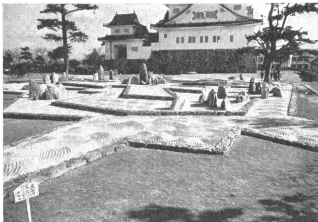
Abb. 5. Innerer Garten im Park der Kishiwada-Burg in Osaka. Verwendung von Felsen und weissem Sand zur Gartengestaltung.

verschont. Nach Kriegsende verband man im Zuge der Neuplanung den wiederaufgebauten Bahnhof von Hi-maji mit der Burg durch eine neue, 50 m breite Hauptverkehrsader und säumte sie links und rechts durch Grünanlagen von Nerium-Odorum- und Pittosporum-Tobira-Pflanzungen.