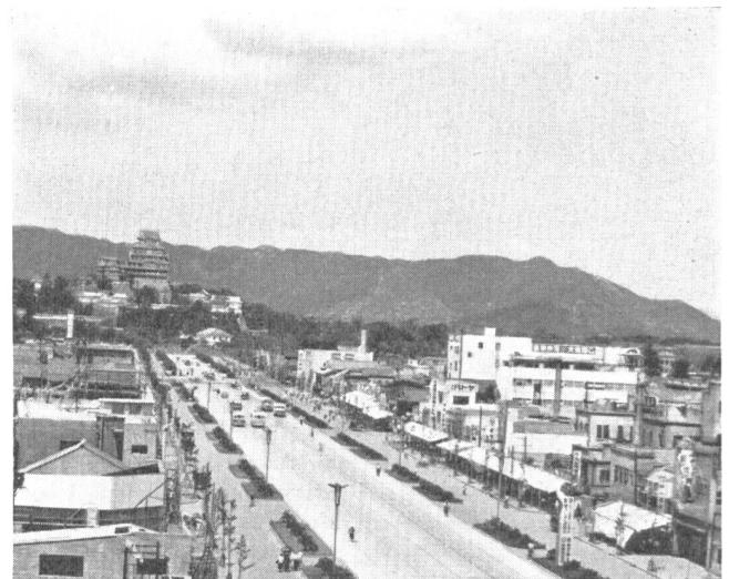
Abb. 2. Himeji-Burg und die neuerstellte Hauptverbindungsstrasse. Als Strassenbepflanzung Gingko Biloba.

ähnlichen, von einer Fülle von einstöckigen, ineinandergeschachtelten Häusern begrenzten Plätzen, nicht mehr zu unserem heutigen modernen Leben passt.