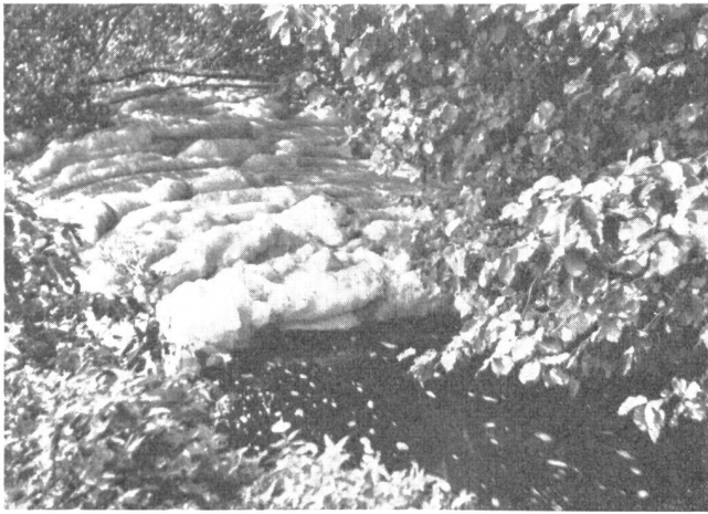
Abb. 1. Ein idyllisches Plätzchen! Die Schaumfladen gehören jedoch nicht dazu. Sie stammen aus einem Betrieb, der stark schaumbildende Stoffe ablässt (z. B. Eiweiss), könnten aber auch durch Jauche bedingt sein.