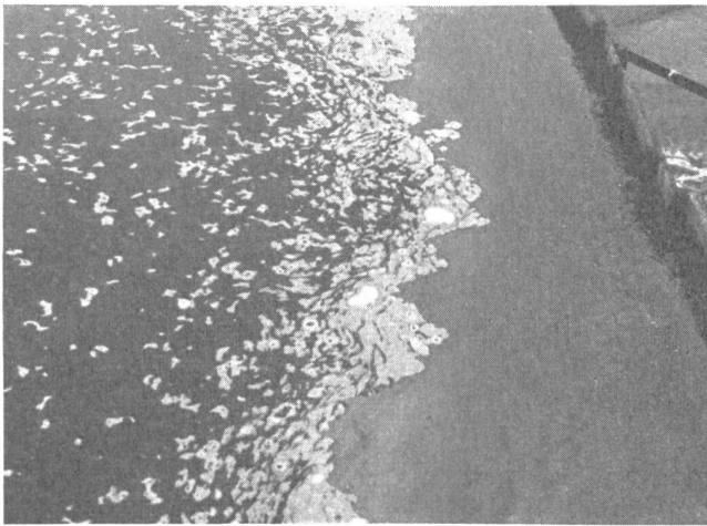
Abb. 3. Diese Schaumbildungen «zieren» eine Flußstrecke auf viele Kilometer. Sie sind hier bedingt durch Eiweissabbauprodukte.

wobei sich salpetersaure Salze (Nitrate) und Ammoniak je nach den Bedingungen gegenseitig ineinander umwandeln können. Ist der Sauerstoff aufgebraucht, so ist der Stickstoff als Ammoniak vorhanden, bei Gegenwart von genügend Sauerstoff aber als Nitrat. In unserem See dominiert glücklicherweise heute noch das Nitrat. Wir geben nachfolgend einige orientierende Zahlen aus verschiedenen Zeiten an, stammend aus Analysen von 10 zu 10 m zwischen 0 und 40 m Tiefe, welche die Konstanz des Chemismus bestätigen: