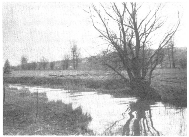
Abb. 2. Die «Ron», der Hauptzufluss des Baldeggersees.

bewirtschaften, unser Baldeggersee, einst «der fischreichste See der Schweiz» benannt, verwandelte sich in einen Karpfenteich, Tempi passati!