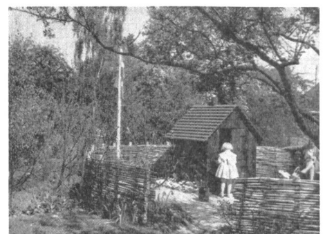
Spezialgarten für Kinder: Ein eigener Garten, mit einem kleinen Hüttchen, beglückt jedes Kinderherz und lässt seiner schöpferischen Phantasie freien Lauf.

Es scheint uns auch heute noch der Mühe wert, zwei dieser Spezialgärtchen herauszugreifen und deren praktische Verwirklichung weiteren Kreisen zu empfehlen. Vg.