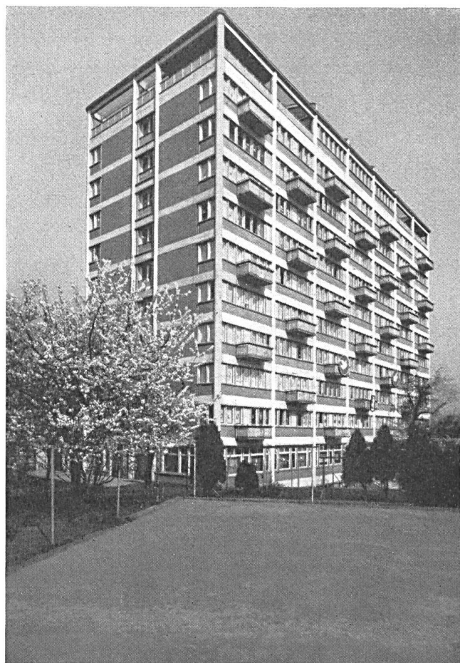
Abb. 5. Das Hochhaus gilt auch in der Tschechoslowakei als architektonisches Mittel zur Gliederung und Belebung des Siedlungsbaues.

Eine weitere grosse Aufgabe, die uns bevorsteht, ist der planmässige Umbau der Stadt, und zwar auch um den Preis einer Sanierung von nicht entsprechen-