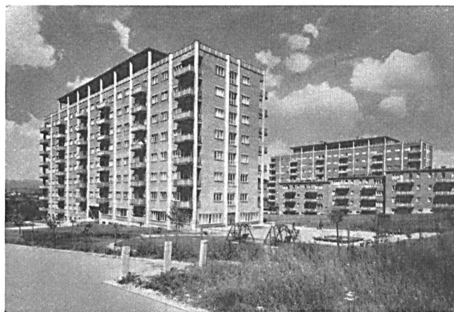
Abb. 2. Gottwaldov: Gemischte Bauweise, nach dem Vorbild der aufgelockerten Stadt.

SS-Abteilungen Hitlers verwüstet. Der Landes-Nationalausschuss hat einen Wiederaufbauplan ausgearbeitet, der zur Erprobung neuer Planungsmethoden durchgeführt werden sollte. Es wurden bloss Skizzenpläne ausgearbeitet, und zwar ohne eigentliche Vorbereitung und ohne Rücksicht auf die gesamthaften Bedürfnisse und Möglichkeiten dieser Gegend.