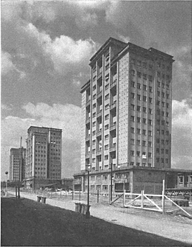
Abb. 6. Im tschechischen Städtebau dominiert nicht das Einzelhochhaus, sondern die Hochhausgruppe.

projekten gebaut. Die bisherigen Versuche einer Typisierung der landwirtschaftlichen Bauten gingen von einzelnen Objekten anstatt von Objektkomplexen aus.