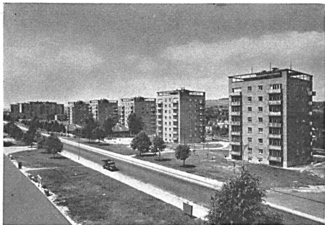
Abb. 1. Gottwaldov: Gruppe von höhern Häusern, als Versuch zur aufgelockerten Stadt.

Der Aufbau unserer Siedlungen nach dem Jahre 1952 entwickelte sich schon unter dem Einfluss der sowjetischen Theorie und Praxis, die bei uns erst nach dem Jahre 1950 zur Geltung kam. Der sowjetische Städtebau ist durch die Betonung der Oekonomik und Technik im Aufbau der Städte gekennzeichnet und hat durch seine Bemühungen um Anwendung der besten Weltradiationen im Städtebau, durch seine konkrete Stellungnahme zu realen Gegebenheiten und durch die Betonung der ersten Etappe des Aufbaus auf unsere Gebietsplanung einen starken Einfluss aus-