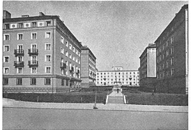
Abb. 3. Beispiel des repräsentativ-monumentalen Stils russischer Prägung.

Aus diesen Gründen überwiegt in solchen Siedlungen der Mangel einer raumgestaltenden Kraft und eine allgemeine Monotonie, welche dadurch, dass es im grössten Teil dieser Siedlungen nicht gelungen ist, Grünflächen anzulegen, noch gesteigert wird.