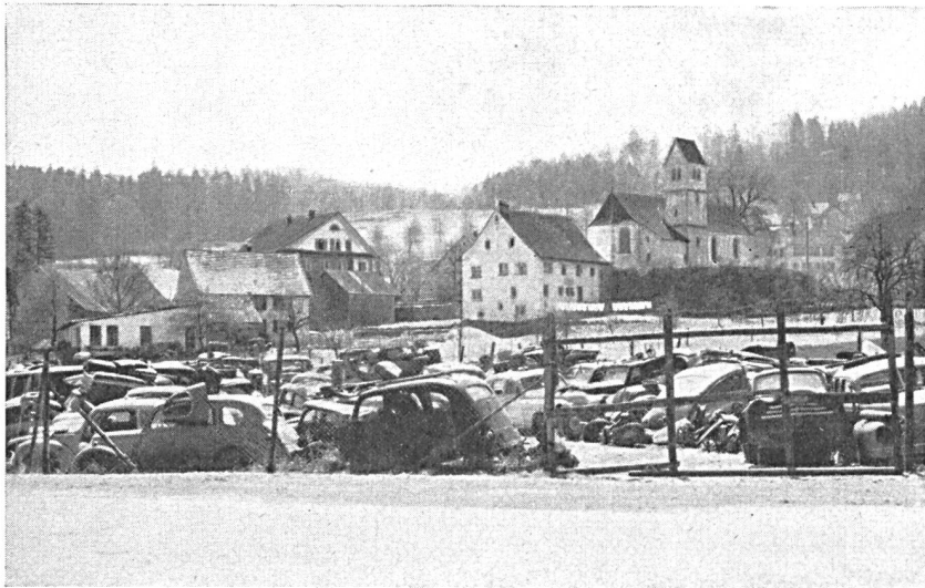
Abb. 1. Autofriedhof in Wohlenschwil AG, an der Strasse Lenzburg-Baden. Im Hintergrund die zum Bauernmuseum umgewandelte alte Kirche. Der das Ortsbild und die landschaftliche Umgebung verunstaltende Autofriedhof gab Anlass zu einer Interpellation im aargauischen Grossen Rat.