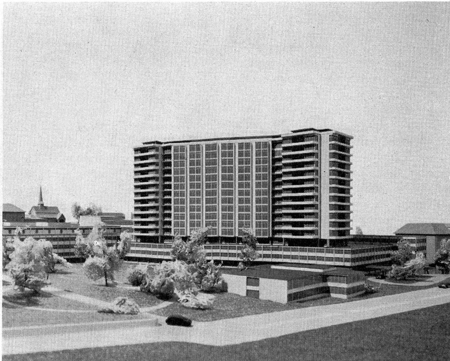
Abb. 2. Südansicht des Bettenhauses.

Sie liegen im wesentlichen in dem insgesamt 16 Stockwerke zählenden Hochbau. Dieser ist, seiner inneren Aufteilung entsprechend, architektonisch in zwei Kopfpartien und einen Mittelbau gegliedert. Der