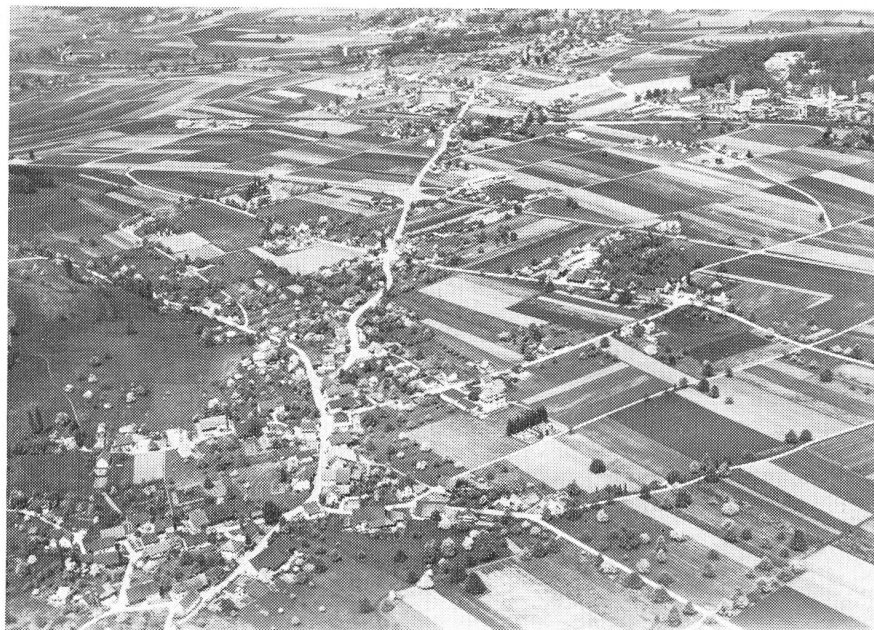
Abb. 5. Dottikon AG: Querfeldein wuchert die Ueberbauung den Strassen und Flurwegen entlang.

Ich sehe damit in der Güterzusammenlegung und in der Aussiedlung landwirtschaftlicher Betriebe eine Massnahme der Allgemeinheit für die Allgemeinheit. Neben das landwirtschaftliche Interesse tritt das siedlungspolitische Interesse, und dieses überwiegt in stadtnahen Gebieten sogar ganz beträchtlich.