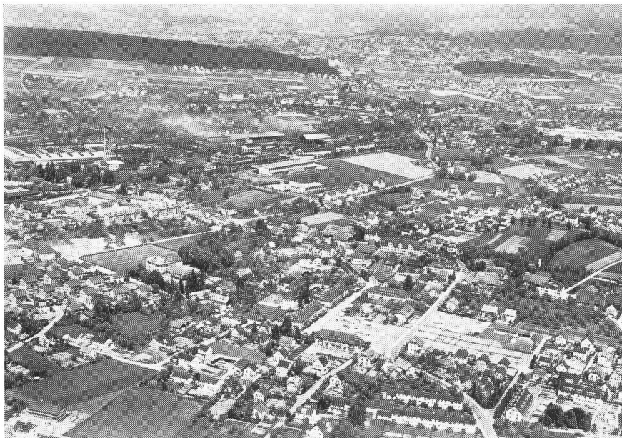
Abb. 4. Gerlafingen SO: Die ganze Landschaft ist übersät mit Häusern, zwischen denen viele zerstückelte Landwirtschaftsflächen eingeschlossen sind.

zum Opfer gefallen, was aber nicht heisst, dass sie sich nicht bewährt habe.