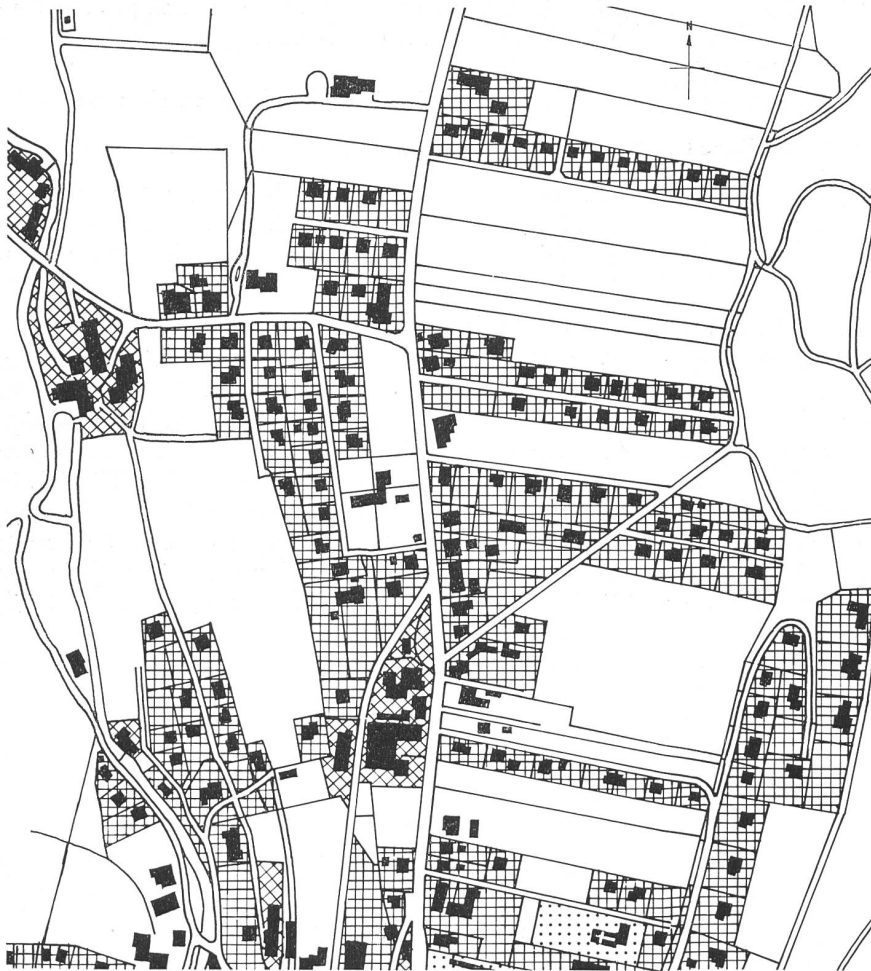
Abb. 2. Schöftland AG: Das Festhalten einzelner Bauern an hofnahen Parzellen im Dorf- innern verhindert eine geschlossene Ent- wicklung des Baugebietes. Aber das zer- rissene Baugebiet verhindert seinerseits eine rationelle Landwirtschaft.

essant ist nun folgendes: Das Fassungsvermögen der heute ausgeschiedenen Wohnzonen reicht gerade aus, um zusammen mit den Gemeinden ohne Zonenplan jene 5,5 Millionen Einwohner aufzunehmen, die bei einem Gesamtbestand von 10 Millionen in der Schweiz auf den untersuchten Landesteil entfallen werden.