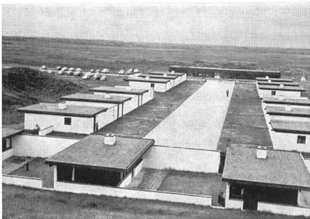
Abb. 2. Teil der Familienferiensiedlung bei Rödhus.

Das Naturschutzgesetz von 1917, mit Aenderungen von 1937, 1959 und 1961, ermöglicht den Schutz von Denkmälern aus vorgeschichtlicher Zeit (z. B. Hünen-