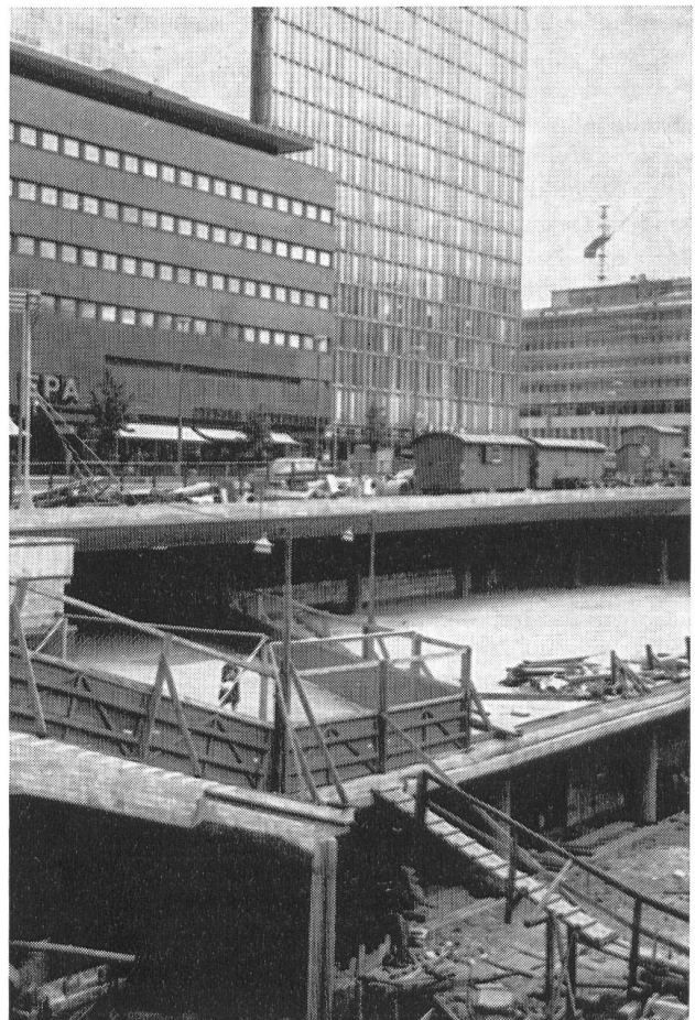
Abb. 4. City-Sanierung in Stockholm: Bau verschiedener Verkehrsebenen beim Sergels torg.

Typisch für die Anlage der Satelliten- oder Trabantenstädte Stockholms ist die Trennung des Fussgänger vom motorisierten Verkehr . Von den Wohnquartieren zum Zentrum und damit auch zu den Anschlüssen der öffentlichen Verkehrsmittel führen eigene Systeme von Fussgängerwegen und -strassen, und auch die Marktplätze, wenigstens der neuen Zentren, sind Fussgängerbereiche. Das ist nur möglich, weil die Zulieferung an die Geschäfte hinterwärts oder unterirdisch erfolgt, wie dies auch bei dem grossen Ladenzentrum Hötorgs city in der Innenstadt der Fall ist.