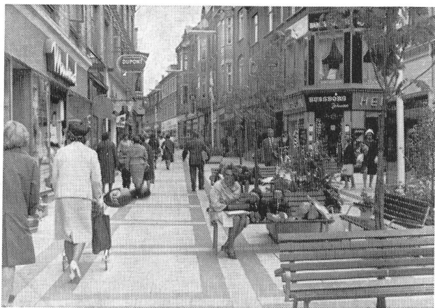
Abb. 1. Verkehrsfreie Geschäftsstrasse in Aalborg.

Die Aalborger Stadtplanung ging in ihrer Arbeit von der bestehenden Topographie und von der wirtschaftlichen Struktur aus. Es war Rücksicht auf die