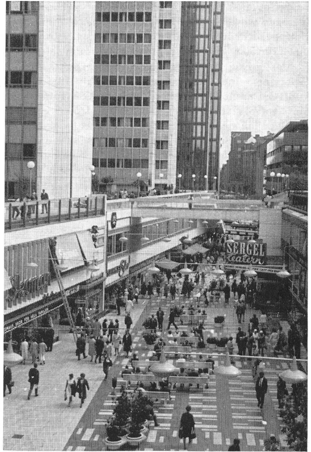
Abb. 5. Hötorget city, das Einkaufszentrum im Herzen Stockholms.

Die 1960 herausgegebene «Prinzipiskizze einer Raumordnung für die Entwicklung in den drei Hauptstadtkreisen bis 1980» umfasst die drei Hauptstadtkreise Kopenhagen, Fredriksborg und Roskilde mit allen zugehörigen Gemeinden, auch den sechs selbständigen Städten, die in einer Entfernung von 30 bis 45 Kilometern vom Zentrum Kopenhagens gelegen sind. Dieser Entwicklungsplan rechnet mit einer Zunahme der Bevölkerung auf zwei bis zweieinhalb Millionen in diesem Gebiet; die vom «Fingerplan» angenommenen 1,5 Millionen sind heute bereits erreicht.