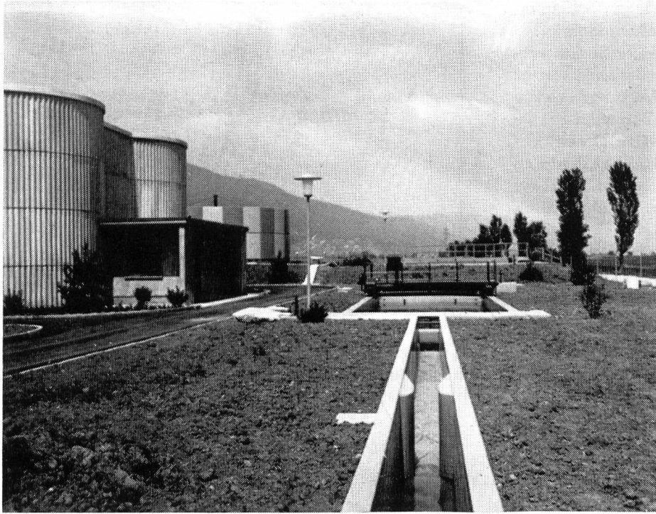
Abb. 3. Kläranlagenzulauf mit Faulbehälter und Tropfkörper der Kläranlage Niederbipp, Kanton Bern.

freien Schlammengenbestimmung bietet sich die induktive Messmethode an. Ihr Vorteil besteht hauptsächlich darin, dass keine Querschnittsveränderungen und keine Verstopfungen eintreten.