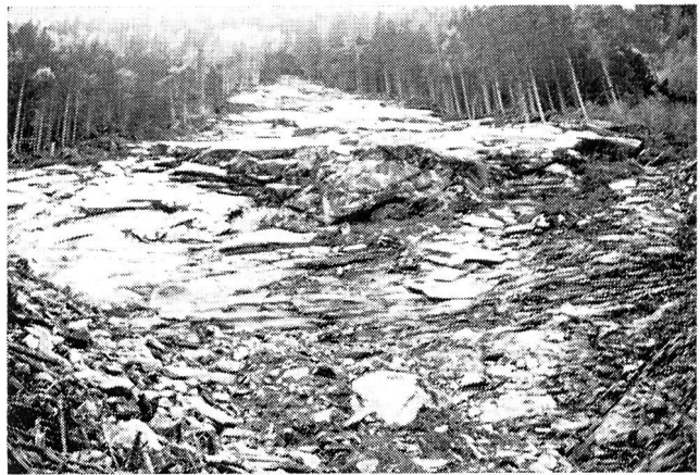
Anbruch im Maltatal. Breite etwa 80 bis 100 m, Länge etwa 150 bis 200 m. Der gesamte Waldbestand mit der ganzen Verwitterungsschwarte ist auf dem blanken Felsuntergrund abgerutscht