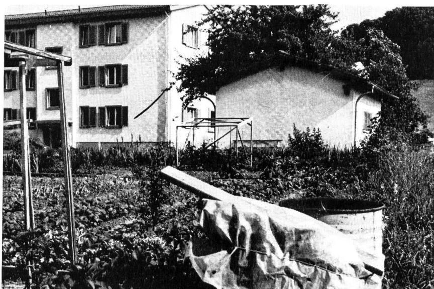
Abb. 1. Trinkwasserfassung ohne Schutzzone am Rand eines Wohngebiets. Eine Gemeinde hatte vor 25 Jahren in einer angemessenen Schutzdistanz von dem damals talaufwärts noch 150 m entfernten Baugebiet ein Grundwasserpumpwerk erstellt. Da keine Schutzzone ausgeschieden wurde, ist heute das Baugebiet mit Wohnhäusern und Gemüsegärten bis in die unmittelbare Nähe des Pumpwerks vorgerückt

Erst 1953 haben die deutschen Fachleute den Begriff der Schutzzone wesentlich erweitert. Sie nannten das bisherige engere Schutzgebiet jetzt «Fassungsbereich» und das bisherige erweiterte Schutzgebiet jetzt «Engere Schutzzone» und schlossen an diese beiden Teile des bisher schlechthin als Schutzzone zusammengefassten Gebietes eine «Weitere Schutzzone» an. In dieser forderten sie aber kaum mehr, als was auch bis anhin über allen nutzbaren Grundwasservorkommen zu den in Fachkreisen allgemein anerkannten Regeln des Gewässerschutzes und der Siedlungswasserwirtschaft gehörte und was deshalb von den Wasserwerkinhabern auch kaum verlangte, besondere Dienstbarkeiten zu erwirken. Im wesentlichen handelt es sich ausserhalb der im engeren Sinn verstandenen Schutzzone darum, durch eine voll-