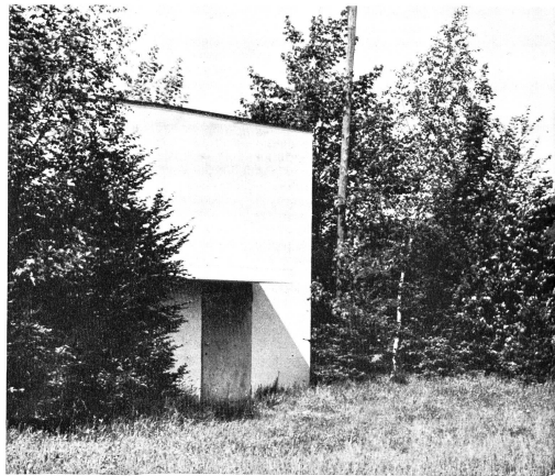
Abb. 3. Trinkwasserfassung mit ausgedehnten Schutzzone in einem Landschaftsschutzgebiet. Das Wasserwerk Reinach und Umgebung (Baselbiet) sicherte sich mit einer zielbewussten Landerwerbspolitik in der Umgebung seiner Grundwasserpumpwerke eine ausgedehnte Schutzzone, die zum Teil aufgelöstet worden ist und zum Teil zum Landschaftsschutzgebiet der Reinacher Heide gehört.

Mit Rücksicht auf den Schutz gegen bakterielle Verunreinigungen postulieren die DVGW-Richtlinien 1961, dass sich die Zone II bis zu einer Linie ausdehnen soll, von der aus das unterirdische Wasser etwa 50 Tage bis zum Eintreffen in der Fassungsanlage benötigt. Begründet wird dieses Postulat damit, dass die normale Lebensdauer von Bakterien im Untergrund 50 Tage betrage (Nöring 1962). Ausser dem Absterben der Bakterien werden also die im Boden ablaufenden Reinigungsvorgänge nicht berücksichtigt. Erfahrungen in der Schweiz haben jedoch gezeigt, dass bakterielle Verunreinigungen in Schottern bereits auf überraschend kurzen Fließzeiten zurückgehalten werden, sofern durch die im ganzen Grundwassergebiet anzuwendenden Gewässerschutzmassnahmen verhindert wird, dass die Belastung mit organischen Stoffen und der Sauerstoffschwund im Wasser kein extremes Ausmass annehmen (Schmassmann 1966, Nänny 1966, Rutsch 1970). In die den DVGW-Richtlinien geforderte Verweildauer ergäbe überdies in den meisten wichtigen Schotter-Grundwässern der Schweiz eine Ausdehnung der Zone II von mehreren Kilometern und damit Schutzzone, die praktisch überhaupt nicht aussehbar wären. Der Schutz