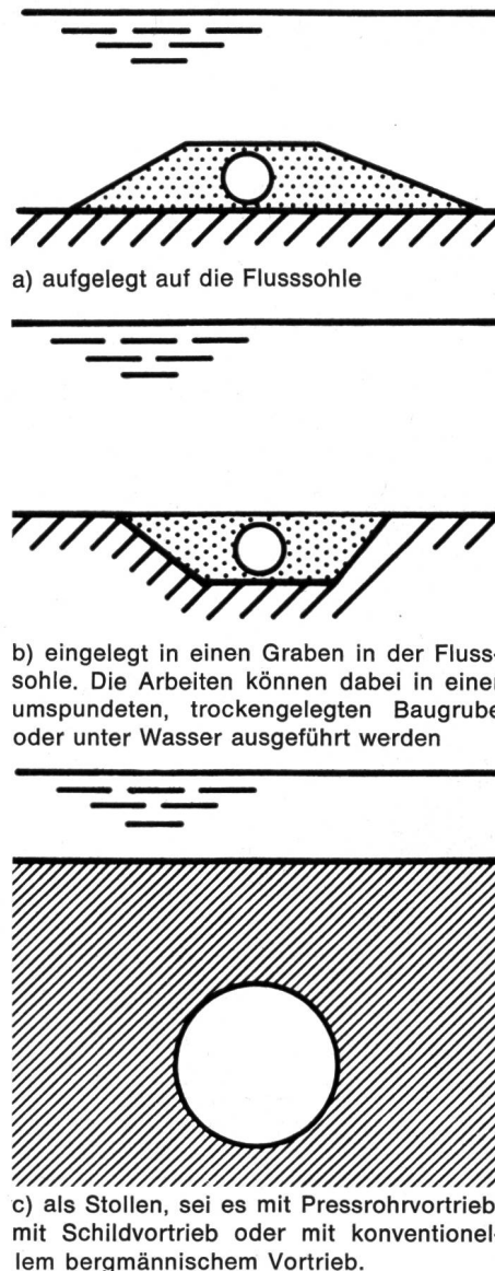
a) aufgelegt auf die Flusssohle

Eine Dükerleitung kann wie folgt erstellt werden: