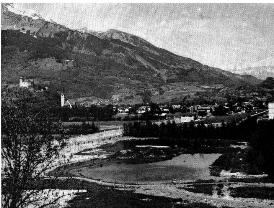
Abb.2. Ein neuer Weg der Oeffentlichkeitswerbung für den Naturschutz: Die Natur- und Erholungsanlage St. Katharinenbrunnen bei Balzers. Am Beispiel neugeschaffener Weiher werden diese Lebensräume mit den dazugehörigen Tieren und Pflanzen dem Besucher präsentiert