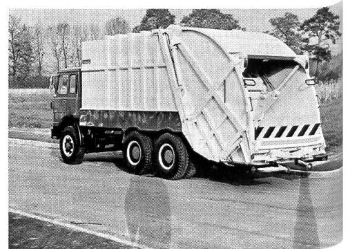
Colectomatic Mark V mit Container-Entleerung

Die Colectomatic Mark IV und V nehmen alles und wurden speziell für schwere, industrielle Müllabfuhr entworfen und hergestellt. Die zwei verschiedenen Arbeitsgänge ermöglichen es, auf derselben Fahrt handelsübliche Container zu entleeren oder losen Müll aufzuladen. Die Modelle Mark IV und V von Heil verfügen über sehr leistungsfähige Ladevorrichtungen, was wirtschaftlichere Arbeitsweise beim gesamten Ladevorgang, grössere Lasten, weniger Fahrten und niedrigere Betriebskosten bedeutet.