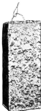
Gewicht: 220 g

bei VS-Annoncen Vogt-Schild AG Kanzleistrasse 80 Postfach 8026 Zürich Telefon 01 39 68 69