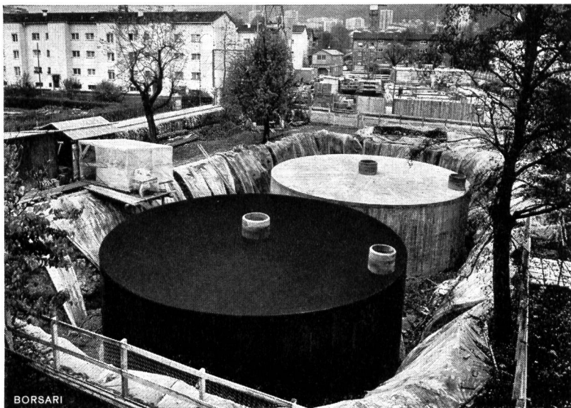
Gemeinnützige Baugenossenschaft Limmattal, Zürich 2 Tanks, total 1 000 000 Liter Heizöl