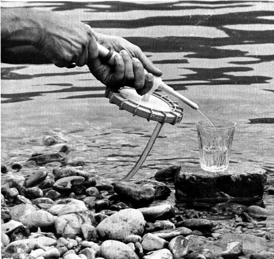
◀ Abb. 1. Das Filopur-Touristenmodell. Mit Handpumpe und praktischem Wassertragsack macht es überall die Entnahme von gesundem und frischem Trinkwasser möglich

Filopuriertes Wasser — Möglichkeit von heute, Notwendigkeit von morgen — ist eine der imponierendsten Lösungen des Trinkwasserproblems.