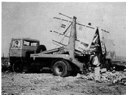
Abb. 1. Entleerung eines KUKA-Pressmüllbehälters. Die Rückwand ist als Ausdrückplatte gestaltet, wodurch die Entleerung mühelos erfolgt

Der immense Anfall von Müll unserer Konsumgesellschaft ist längst zu einem Problem ersten Ranges geworden. Mit welchen geeigneten Mitteln wir aber die umweltfreundliche Entsorgung und Verwertung des Mülls auch immer lösen, der Wirtschaftlichkeitsberechnung muss besondere Bedeutung beigemessen werden. Wir müssen heute immer mehr dazu kommen, offene, ungeordnete Deponien zu