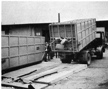
Abb. 2. KUKA-Pressmüllbehälter mit Gleitabsetzkipper

schliessen und an deren Stelle zentrale Verbrennungs- und Kompostierungsanlagen sowie geordnete Deponien zu erstellen. Da jedoch die Anfahrtswege zu diesen Anlagen meist sehr gross sind, ist es daher zu einer kostengünstigen Entsorgung unerlässlich, den Müll zu komprimieren,