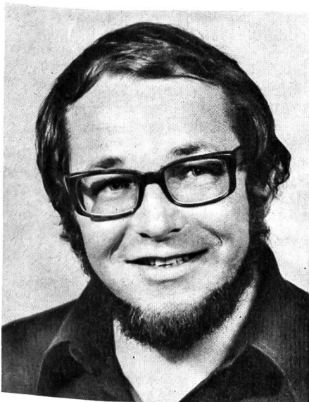
Von Dr. med. Bernhard Segesser, Mitglied der medizinischen Kommission des Schweizerischen Landesverbandes für Leibesübungen, leitender Olym piaarzt 1976

An den Olympischen Sommerspielen in Mexiko 1968 erlebte der Kunststoffbelag seine internationale Feuertaufe mit durchschlagendem Erfolg: Alle Weltrekorde der Kurzstrecken- und Sprungdisziplinen der Leichtathletik wurden unterboten, der Beweis für die positiven Einflüsse von Kunst-