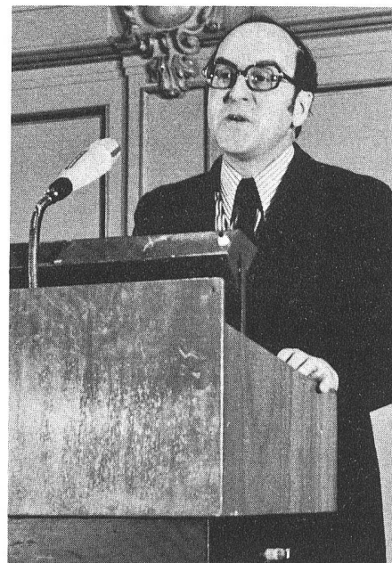
Bundesrat Dr. Kurt Furgler, Vorsteher des Eidgenössischen Justiz- und Polizeidepartements, bei seinem stark beachteten Referat «Raumplanung als föderalistische Aufgabe in der Zeit des Konjunkturreinbruchs»

Gemeinden verlieren, ohne dass sich diese Gemeinden dem Nutzen entsprechend an den Kosten beteiligen; – ländliche Gebiete, die zur Erholung der Stadtbevölkerung dienen und die im Interesse dieser Stadtbevölkerung auf eine bestimmte bauliche Entwicklung verzichten sollten, ohne dafür auch eine Gegenleistung zu erhalten;