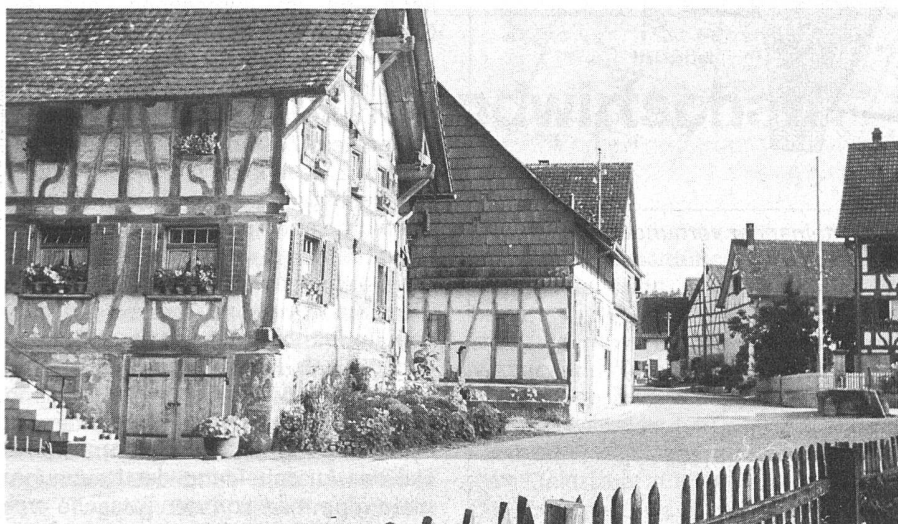
Mettschlatt: Ortsbild von regionaler Bedeutung

Der Regierungsrat des Kantons Thurgau hat im Herbst 1976 die Ortsplanung der Gemeinde Mett-Oberschlatt genehmigt und den neuen Planungsinstrumenten besondere Anerkennung zugesprochen. Die Ortsplanung zeichnet sich nicht nur durch ein grosszügiges Landschaftskonzept aus, sondern formuliert auch eine den ländlichen Verhältnissen angepasste Siedlungspolitik.