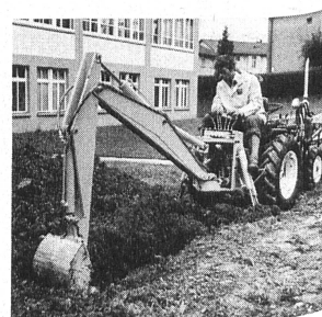
Arbeiten mit dem vollhydraulischen Heckbagger