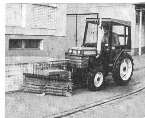
Reinigen mit Kkehrbürste