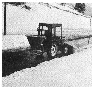
Schneepflügen und Salzen