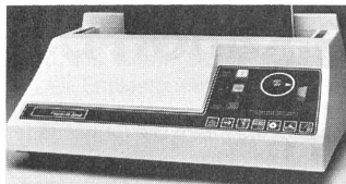
Das neue GBC-Universalbindegerät T-170.

Basierend auf der wichtigen Erkenntnis, dass innerhalb der ständig steigenden Informationsflut die wirkungsvolle Präsentation von Unterlagen einen immer höheren Stellenwert einnimmt, zeigt die GBC (Schweiz) AG ein interessantes Angebot von Möglichkeiten leistungsfähiger Informationsaufwertung! Nach übereinstimmender Ansicht vieler Experten sollte dem Bereich Textpräsentation, im Einklang mit rationeller Textverarbei-