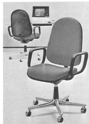
Der neue Arbeitsstuhl aus dem «polytrop»-Programm der Stollgiroflex AG.

Der führende Bürostuhlhersteller Stollgiroflex wird an der diesjährigen Büfa mit den Erfolgsserien «polytrop» und «lignas» vertreten sein. Zahlreiche Neuheiten sind angekündigt. Im Vordergrund steht ein neuer Stuhl für den modernen Arbeitsplatz als Ergänzung der «polytrop»-Serie. Hervorragendstes Merkmal ist die extrem hohe Rückenlehne, welche den ganzen Rücken abstützt. Damit entspricht der Stuhl insbesondere auch den Anforderungen von Bildschirm-Arbeitsplätzen. Gleichfalls zur Ergänzung der «polytrop»-Serie wird dem Besucher ein neu entwickelter Klubtisch vorgestellt. Zu diesen Erweiterungen bei bestehenden Programmen kommt noch eine grundlegende Neuentwicklung für den Sitzmöbelbereich