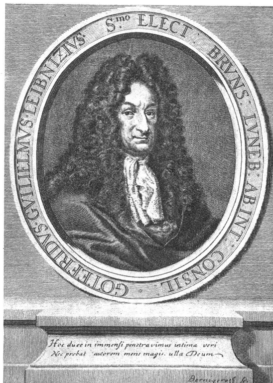
Stich von Berningeroth

stellen konnte. Er erhielt den Auftrag, die beiden Fürstenhäuser nach sechshundertjähriger Trennung durch eine Heirat wieder zu vereinigen, was im Jahre 1695 auch wirklich geschah. Zur Feier dieser Verbindung ließ er eine silberne Denkmünze mit allegorischen Darstellungen prägen (Bild 1).