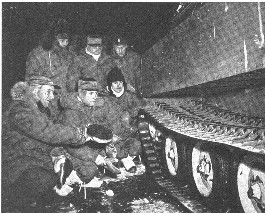
Wie sorgfältig die technische Vorbereitung war, beweist das Bild, welches die Konstruktion der Raupenbänder und der darauf aufgenieteten Schneegreifer zeigt. Die beiden nebeneinander angeordneten Raupenbänder und die darauf befindlichen nicht überall gleich hohen Metallgreifer, die auch noch einen Gummi-gleitschutz erhielten, machten ein Rutschen unmöglich. Russische, chilenische, peruanische und amerikanische Militärattachés lassen sich vom Führer der Expedition die Details des Raupenantriebs erklären.