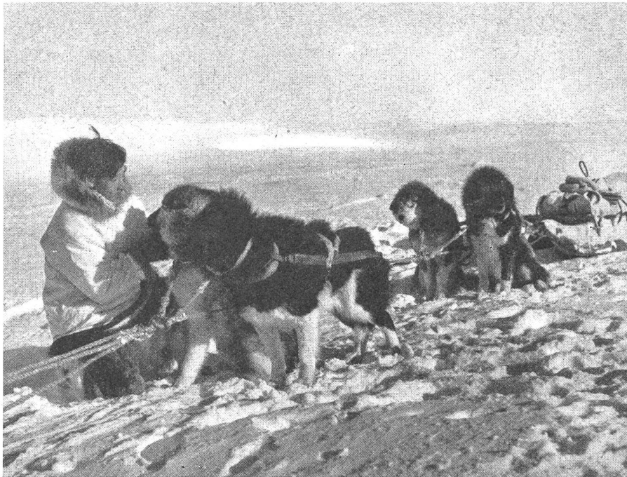
Dort, wo für Schneeautos das Gelände unpassierbar wurde, mußte wieder zum uralten Verkehrsmittel der Arktis – dem Hundeschlitten – gegriffen werden. Auf der Strecke zwischen Cambridge- und Denmark Bai, auf den «Seitensprüngen», die sich die Führer der Expedition erlaubten, leisteten Polarhunde und ihre Führer, die Eskimos, große Dienste.