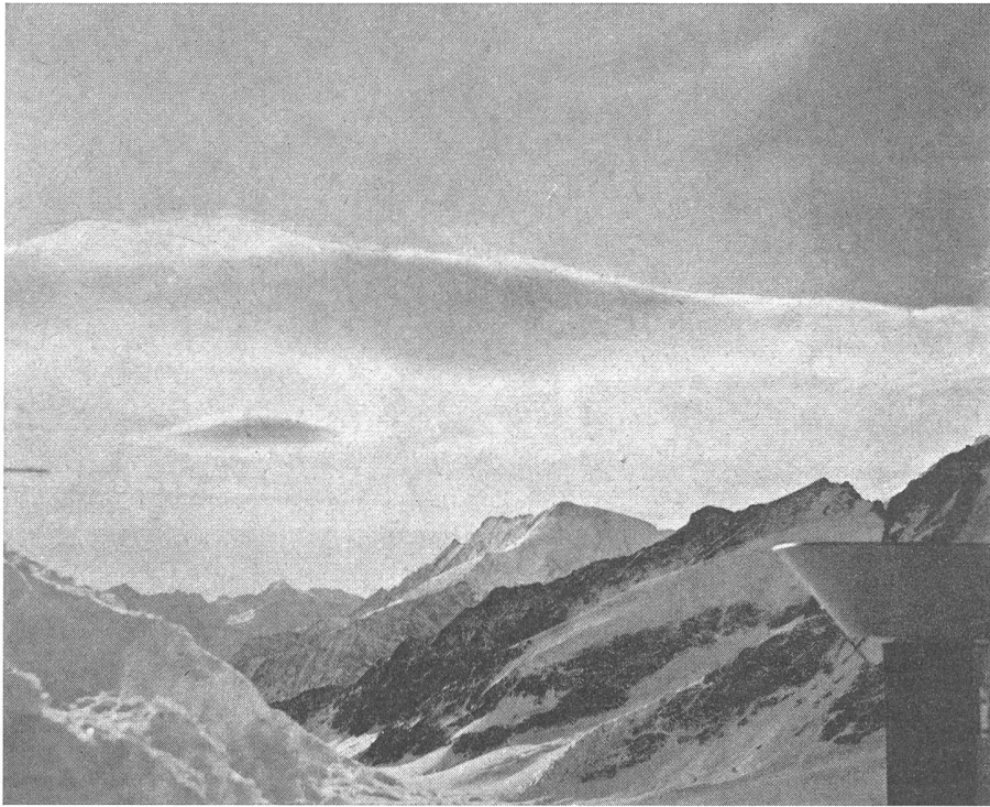
Bild 1: Die typische Föhnwolke, der Altostratus lenticularis , vom Jungfrauoch aus gesehen.

Für die Einwohner eines Alpenlandes wie der Schweiz ist es wichtig, von Zeit zu Zeit zum Problem des Föhns Stellung zu nehmen. Einerseits unterliegt der Inhalt des Begriffes «Föhn» wechselnden Anschauungen, andererseits lösen neuere Erkenntnisse alte Streitfragen, stellen aber mit ihren Lösungen wieder neue Probleme zur Diskussion. Zudem hat der Föhn einen wesentlichen Einfluß auf das Klima und stellt einen wertvollen Faktor für die Entwicklung der Vegetation dar, übt aber gleichzeitig unter allen Erscheinungen des täglichen Wettergeschehens, sowohl in physischer als in psychischer Beziehung, die stärkste Wirkung auf den gesunden und den kranken Organismus aus. Viele Menschen, die nie auf Föhn reagiert haben, werden föhnkrank bei längerem Aufenthalt in Föhngebieten und die allgemein anerkannte Beeinflussung des Menschen durch den Föhn geht so weit, daß in Föhngebieten, wie zum Beispiel in Innsbruck, bei Urteilsprüchen der Föhn ein strafmildernder Umstand bei Affekthandlungen ist.