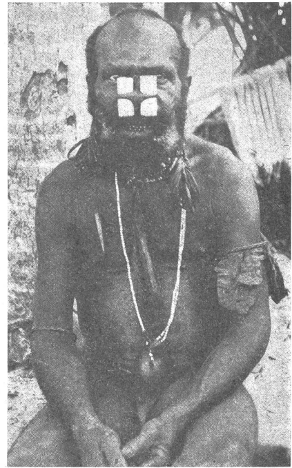
Bild 4 oben: Papua von Südwest-Neuguinea mit Knochenabschnitten in den durchbohrten Nasenflügeln. – Bild 5 Mitte: Massaifrau mit reichem Ohr- und Halsschmuck. (Photo A. C. Holls). – Bild 6 unten: Garoweib mit reichem Ohrschmuck. In jedem Ohr trägt sie fünfzig und mehr Ringe, so daß die durchbohrten Ohrläppchen durch die Last stark in die Länge gezogen werden. (Photo George Newnes Ltd.)

Außer Metallschmuck dienen in Indonesien und Melanesien Schweinezähne, zierlich geschnittene Gehänge aus dem Schnabel des Nashornvogels, Zierat aus Knochen, bei den Naga auch große Bündel von Baumwolle oder rotgefärbtem Ziegenhaar als Ohrgehänge. – Aber nicht bloß das Ohrläppchen wird durchbohrt, sondern häufig auch die Ohrmuschel und die Ohrleiste, in denen man allerhand Knöpfe und Stifte befestigt. Häufig ist die Verstümmelung der Ohrleiste ein Zeichen der Trauer.