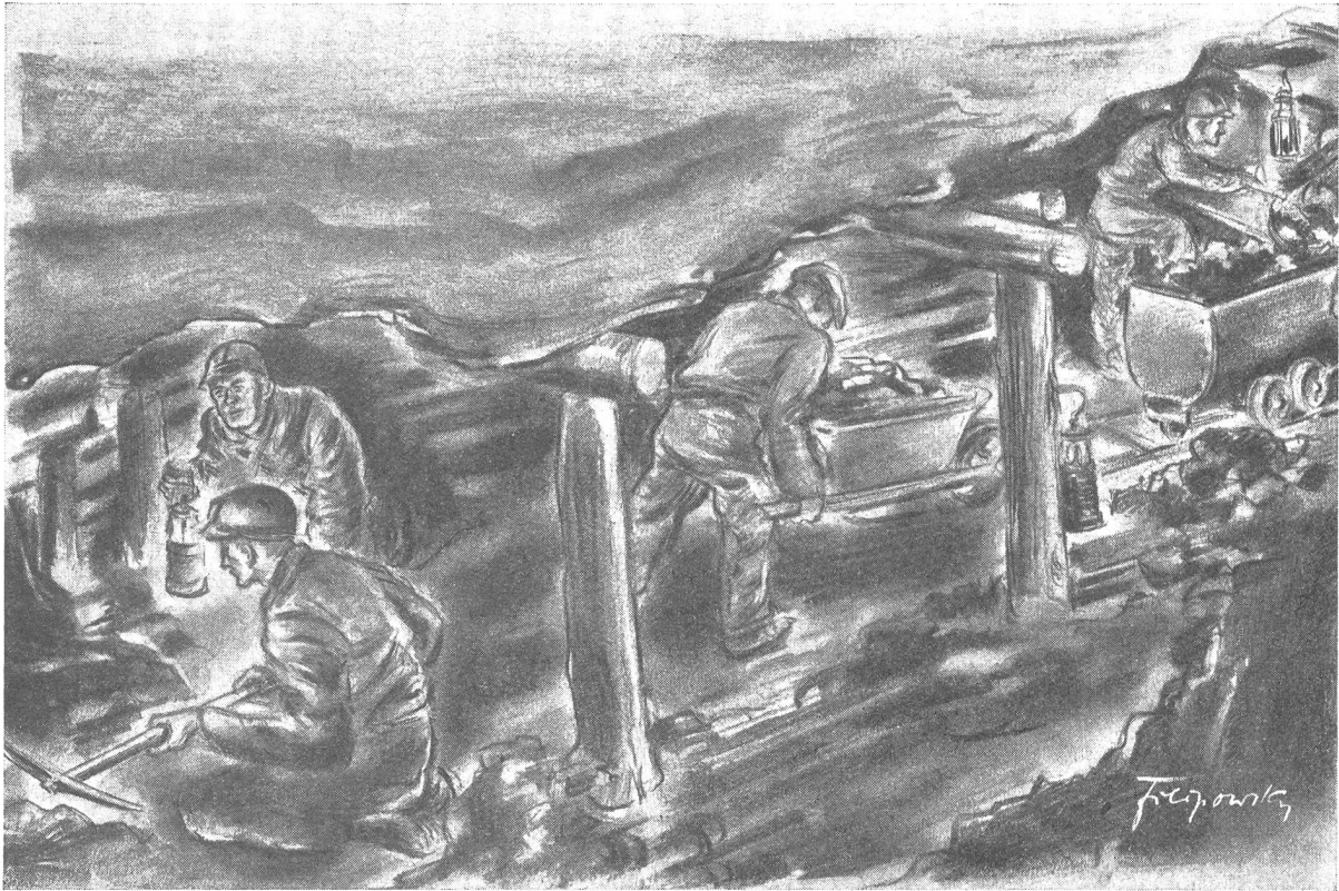
Kohlenzeichnung von Heinz Filipowsky

«Die Kohlenzeit, in der wir leben, mit ihrem rußigen Schweiß, ihren wütenden Kriegen um den ‚schwarzen Diamanten‘, wird in der Geschichte eine kurze barbarische Periode bleiben, in der es nie gelang, Not und Verblendung ganz zu überwinden. – Die Gewinnung von Kohle und Öl gehört zu den mühseligsten Arbeiten, die Menschen ausführen. Sie zwingt die Menschen, in tief unter die Erde getriebenen Schächten, ohne Sonne, ohne freie Luft, umgeben von der Gefahr giftiger Gase, in unnatürlichen Körperstellungen eine Arbeit zu leisten, die mit dem Fluche des Schweißes mehr beladen ist als irgendeine andere. Und . . . Bergleute sterben schon mit vierzig Jahren.» Dr. A. Hahn, Oxford