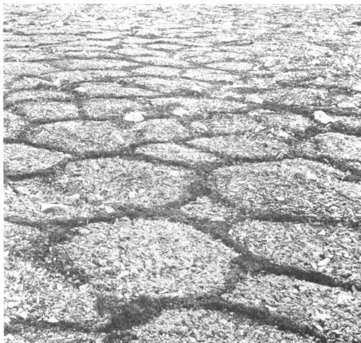
Bild 1: Ein fast regelmäßiges Polygonfeld im Anfangsstadium. Jedes dieser Vielecke hat einen Durchmesser von rund 60 cm.