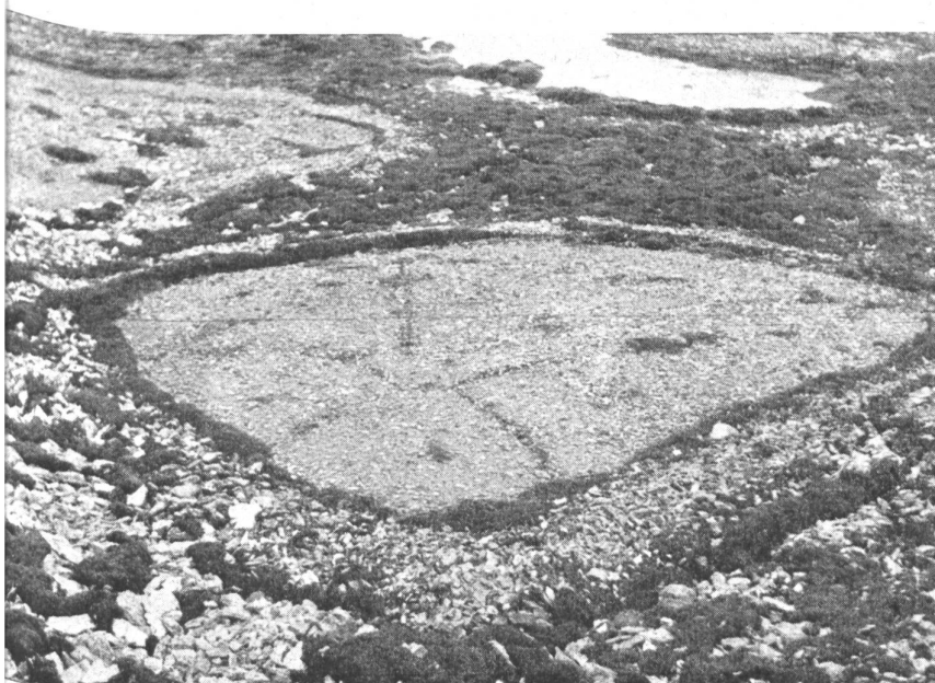
Bild 3: Ein großes, aussortiertes Polygonfeld, dessen Wall zum Teil von Moospolstern überwuchert ist. Im Innern beginnen sich bereits wieder neue Polygone zu bilden.